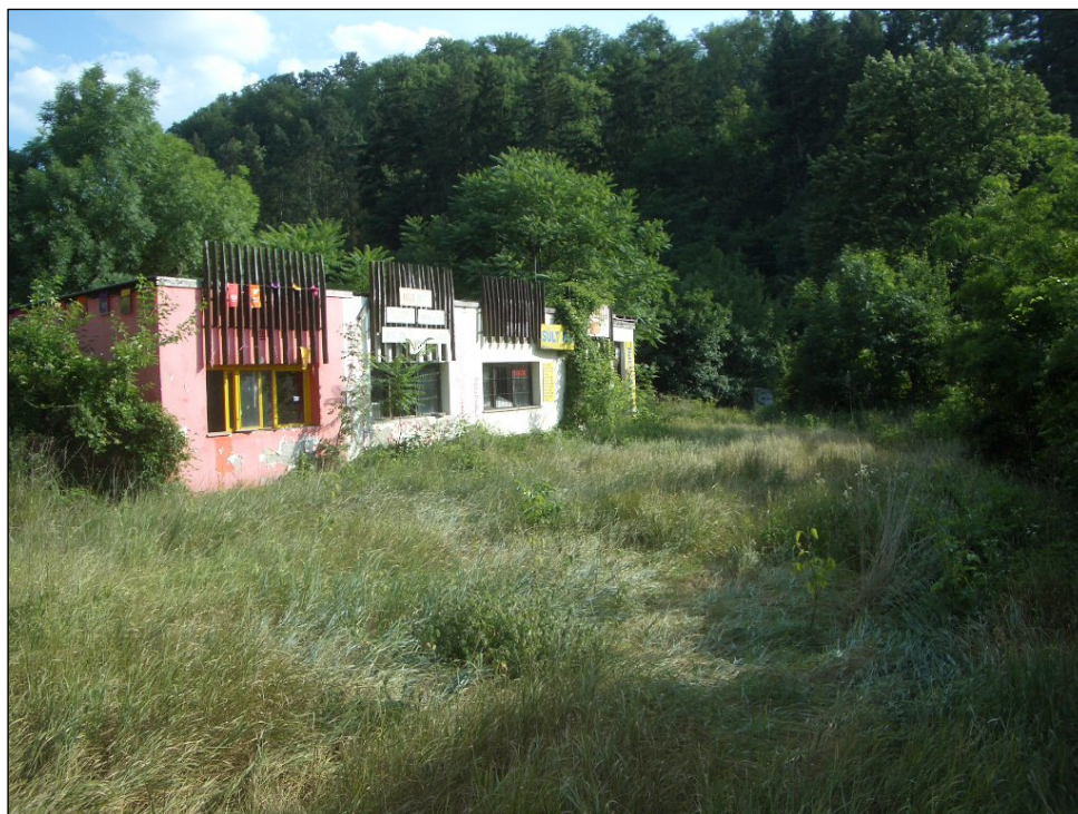
LASSAN AZ ERDŐ AZ EGÉSZ STRAND TERÜLETÉT BIRTOKBA VESZI

AZ EGYSZERI BERUHÁZÁSI KÖLTSÉGEK NAGYSÁGÁRA VALÓ TEKINTETTEL SZÜKSÉGESNEK LÁTJUK, HOGY AMENNYIBEN A BERUHÁZÁSI SZÁNDÉK „KOMOLLYÁ” VÁLIK, AZ ÖNKORMÁNYZAT TOVÁBBI ELEMZÉSEKET VÉGEZZEN VAGY VÉGEZTESSEN, ILL. FENTEBB EMLÍTETT FINANSZÍROZÁSI LEHETŐSÉGEK FELTÁRÁSA ÉRDEKÉBEN TÁRGYALÁSOKAT KEZDJEN ÁLLAMI, BANKI ÉS MAGÁNBEFEKTETŐI SZEREPLŐKKEL.