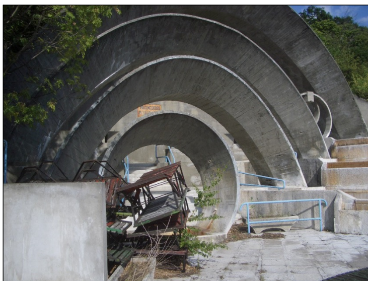
AZ ÜLŐMEDENCE MÉG ŐRZI RÉGI BÁJÁT

A FENTI TÁBLÁN LÁTHATÓ, HOGY A VÁRHATÓ BEVÉTELEK MEGHALADJÁK A 488 MILLIÓ FT-OT. ENNEK ÉRTELMEBEN A BERUHÁZÁS PÉNZÜGYILEG FENNTARTHATÓ, AZONBAN A MEGTÉRÜLÉSI SZÁMOK ALAPJÁN MEGVALÓSÍTÁSA KIZÁRÓLAG VISSZA NEM TÉRÍTENDŐ TÁMOGATÁS IGÉNYBEVÉTELÉVEL EGYÜTT LEHET REÁLIS.