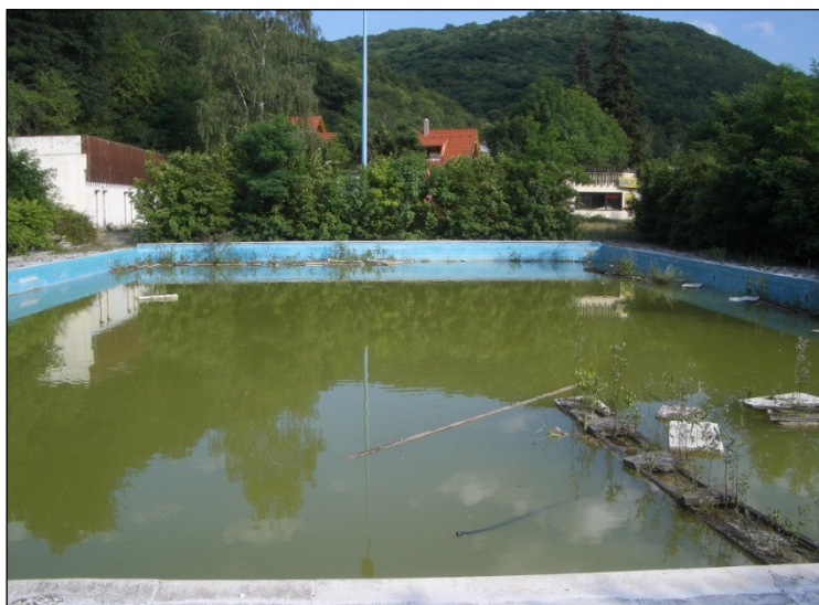
BOKROK NŐNEK A MEDENCÉK SZÉLÉN, SŐT MÁR AZ USZADÉKBÓL IS CSEMETÉK SARJADNAK

MINDEBBŐL KÖVETKEZIK, HOGY AZ APARTMANHÁZAK MEGÉPÍTÉSE NÉLKÜL EZ A MEGVALÓSÍTÁSI ALTERNATÍVA IS PÉNZÜGYILEG FENNTARTHATÓ, UGYANAKKOR MEGVALÓSÍTÁSA SZINTÉN KIZÁRÓLAG VISSZA NEM TÉRÍTENDŐ TÁMOGATÁS IGÉNYBEVÉTELÉVEL EGYÜTT LEHET REÁLIS.