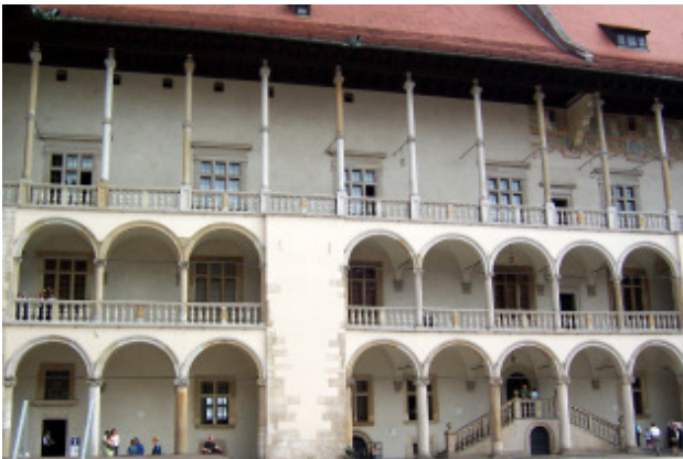
A Wavel udvara a reneszánsz kerengővel