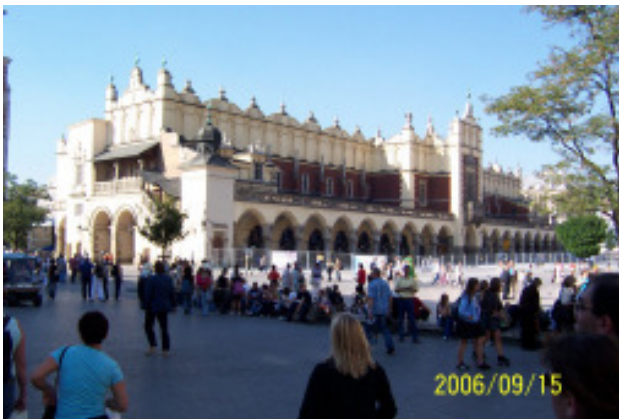
A Posztócsarnok Krakkó főterén

Az énekkar és fúvószenekar krakkói kirándulása képekben