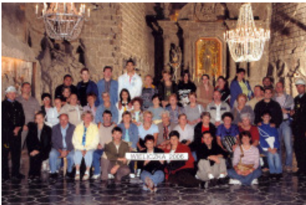
A kirándulás résztvevői a wieliczka-i sóbányában