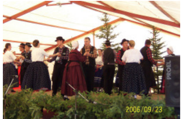
Sváb táncok előadása