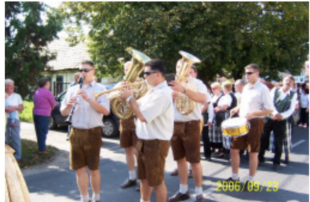
A taksonyi Szigeti fiúk