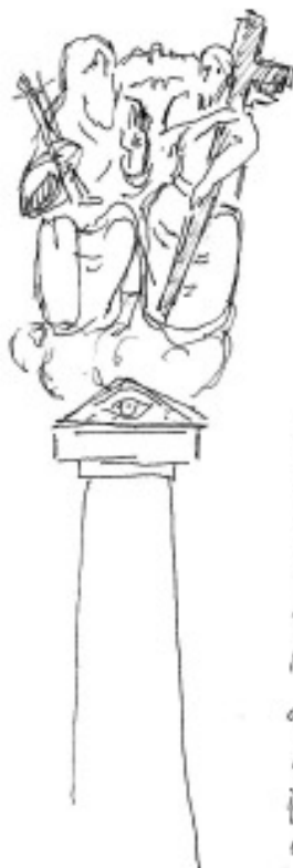
A Szentháromság-szobor rajzos terve