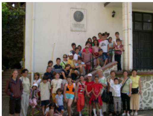
Csoportkép Nagyenyeden az Áprily-dombormű előtt

méltó külsejével nyugodt le bennünket, az utóbbi pedig a természeti környezet utánozhatatlan méltóságával, szépségével és nyugalomával kápráztatott el ismételtelen mindenkit. A 2008. évi VI-PA tábor egyik kiemelt programja volt részünkről a szász városok, várak, erődtemplomok megismerése. Két évvel ezelőtt is már útba ejtettünk néhányat. Most megismerhettük Medgyes, Nagydisznód, Szászváros, nevezetességeit, főtereit, a szász települések sajátos utcaképét.