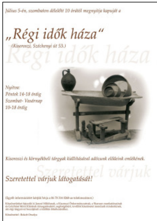
A kiállítás plakátja

(Információ: 06 (70) 314-0268 vagy regiidokhaza@freemail.hu )