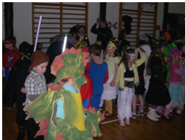
Jelmezesek egymás közt

Visegrád, a KÁOSZ üzletház hozzájárulását a tombolóhoz.