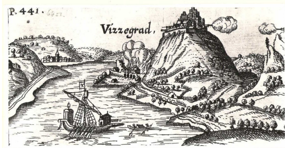
Visegrád és környéke egy régi metszeten