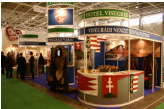
Visegrád standja az Utazás 2009. kiállításon

Ezúton szeretném megköszönni a társkiállítóknak (Thermal Hotel Visegrád, Hilton Visegrád, Visegrád Tours, Pro Visegrád Kht., Pilisi Parkerdőgazdaság), hogy a közös összefogással lehetővé tették, a Visegrád ünnepi évéhez méltó megjelenést. Remélem és kívánom, hogy mindegyikük számára megtérüljenek a vállalt többletkiadások.