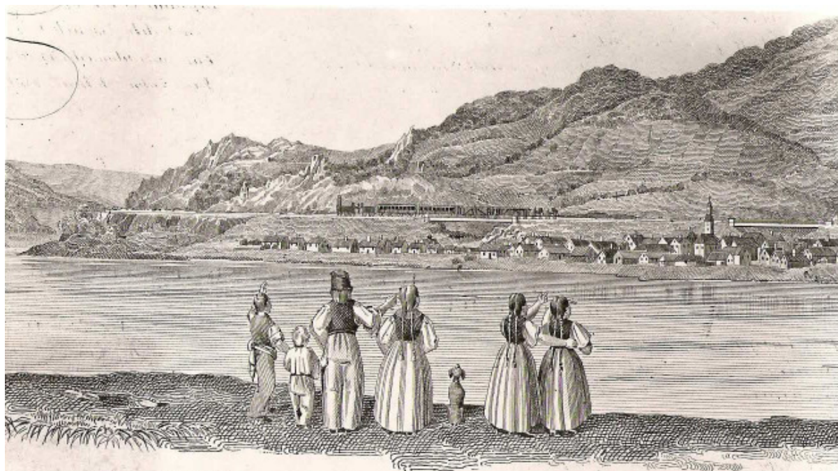
Nagy Maros Tekéntete na balpartján Visegrádnak által ellenében.