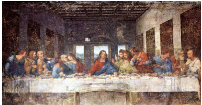
Az utolsó vacsora: Jézus tanítványai között

Áldott húsvéti ünnepeket kívánunk minden Visegrádinak, minden Kedves Olvasónknak!