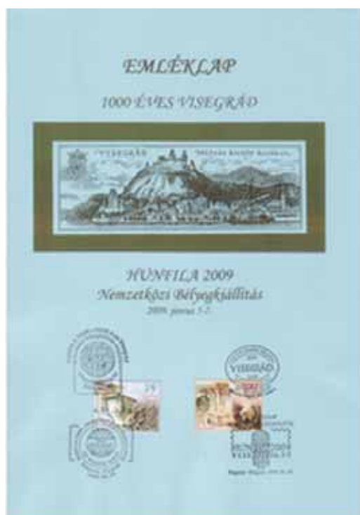
A kiállítás emléklapja