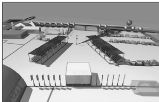
A terület nézete az egészségház felől. Előtérben a szentmise színhelye (színpad), két oldalról zászlóssorral