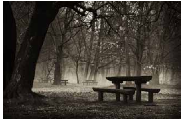
Téli rét 2.

A továbbtanulási szándékomat is nagyban befolyásolja az eddig hobbiként üzött fotózás, mert a Bálint György Újságíró Akadémiára szeretnék bejutni, a fotóriporter szakra. Őszintén szólva, ebben az évben még nem sok esélyt látok erre, mindenesetre megpróbálom. Ha pedig ez a tervem nem jár eredménnyel, hobbiszinten akkor is életem részévé vált már a fotózás.