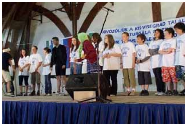
A brnói delegáció előadása