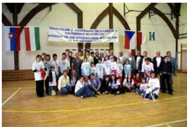
A résztvevők egy része