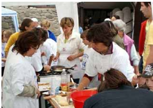
Szlovákiából érkezett csoport, sütés közben

Az alábbiakban néhány kép a konkrét programokról beszél: