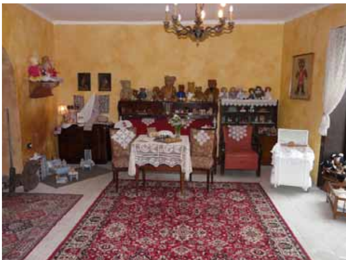
A babakiállítás enteriőrje