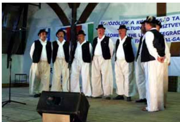
A nagycétényi férfi dalkör

Pénteken Visegrád nevezetességeivel gyalogtúrán keresztül ismerkedtek meg a résztvevők, a nap a lovagi torna megtekintésével zárult.