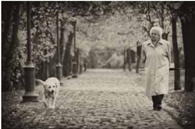
Valaki hiányzik közülünk

tam, de a magányos fáról készült kép is egyik kedvencem. A legizgalmasabb talán mégis a Valaki hiányzik közülünk című képem, amit Esztergomban vettem lencsevégre. A kép két alakja, az idős néni és a kutya egymástól olyan távolságban sétált, hogy óhatatlanul az az érzésem támadt, hogy kettejük közötti helyről hiányzik valaki, a néni párja.