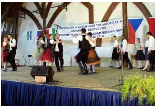
A Mórince táncsoport Nagykérről zoboraljai lakodalmast ad elő