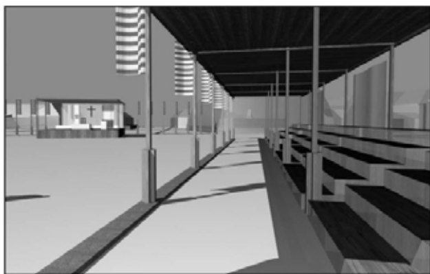
Látvány a nyugati oldali lelátóból. Jól látható a szentmise helyszínéül szolgáló színpad