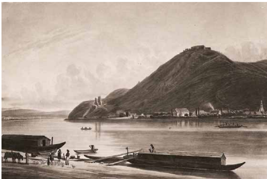
Az egykori Visegrád Nagymarosról nézve