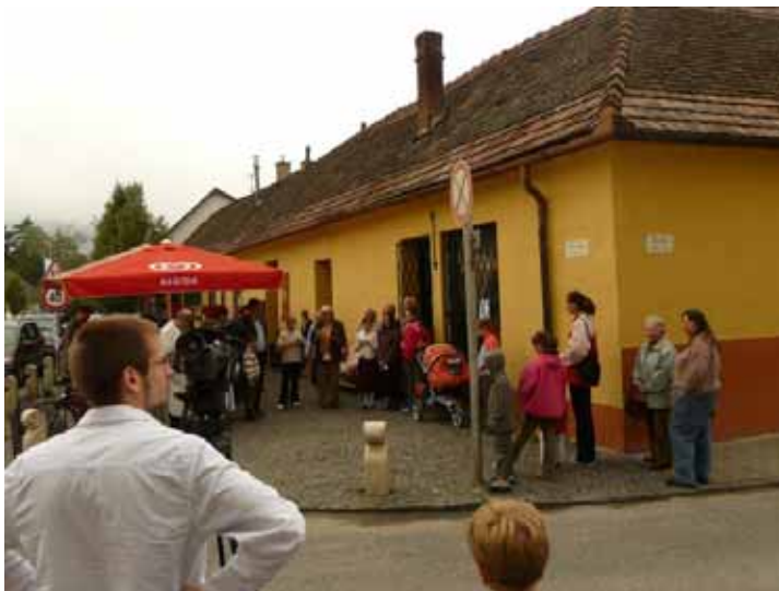
A kiállítás-megnyitó közönsége a Scheili-ház előtt