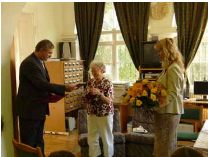
A polgármester úr átadja a diplomát, a jegyző asszony virággal köszönti az ünnepeltet