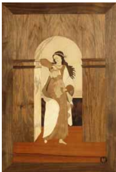
Hönich Imre Mértékletesség című műve

Egy különleges kiállításra invitálunk mindenkit a Salamon-torony emeleti kiállítótermébe, ahol az Intarziakészítők Országos Egyesülete tagjainak legjobb munkáit tekinthetik meg július 4-étől. A kiállított képek között látható a Mátyás Király Múzeum reneszánsz évi kézműves pályázatának nyertes alkotása is.