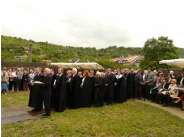
Püsködhétfőn volt a református templom szentelése