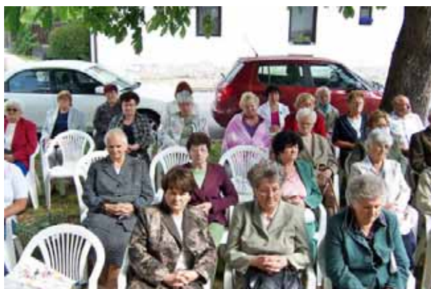
A szentmise résztvevőinek egy csoportja