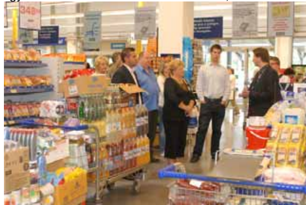
Gazdag a polcok kínálata

Összességében a megnövekedett árukészlettel mostantól az A-tól Z-ig palettán nemcsak termékeket, hanem komplett megoldásokat is kínálunk, partnereink napi szükségleteihez igazodva, legyen az akár egy teljes étterem berendezése, a hozzá tartozó konyha vagy hotelszoba eszközeinek beszerzése, felszerelése.