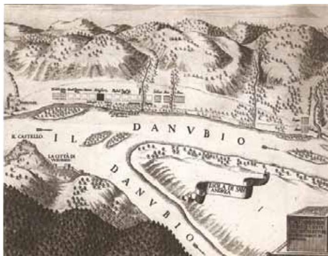
A visegrádi vár és a város egy régi metszeten: szemben Nagymaros, a Börzsöny csúcsai és a Szentendrei-sziget csücske

TANÉVNYITÓ ÜNNEPÉLY augusztus 31-én (hétfőn) 17 órakor lesz A tankönyvárúsítás időpontjában lesz a zeneiskolai beiratkozás és térítési díj fizetése