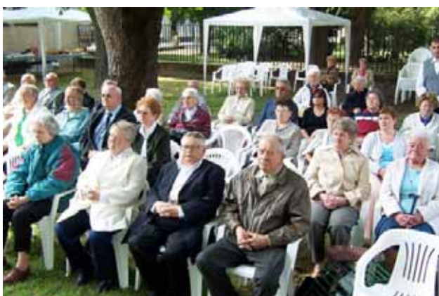
A Millenniumi-kápolna búcsúját június 6-án tartották