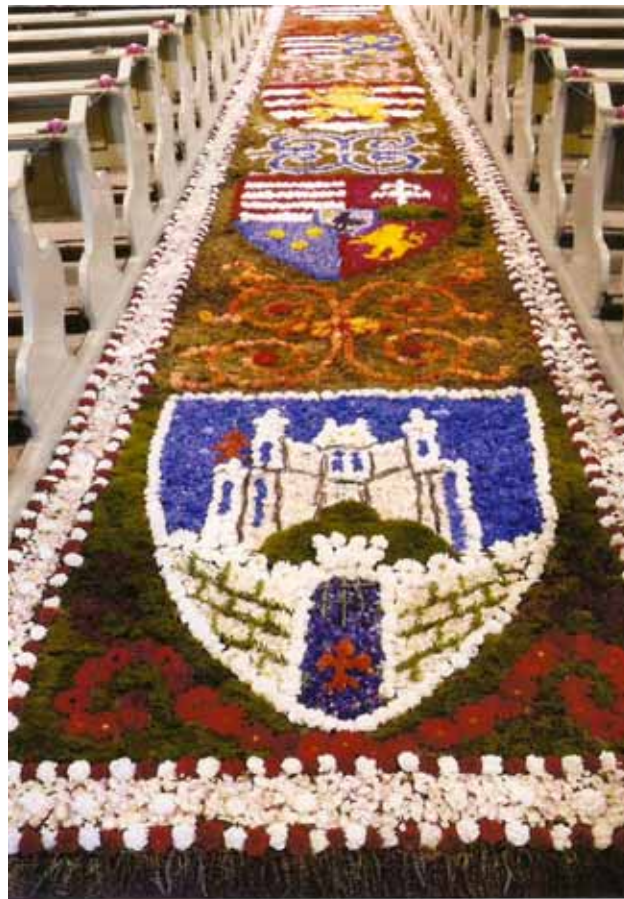
... és ugyancsak méltó volt városunk millenniumához