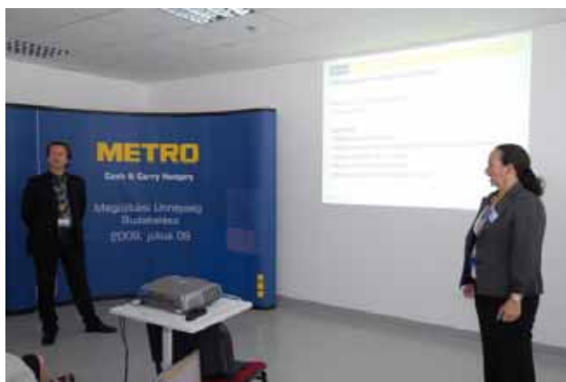
Az új METRO áruház bemutatása

Az elsődleges cél az volt, hogy mostantól még inkább a professzionális vásárlók igényeit tudjuk kielégíteni, teljes körű megoldásokat kínálva. Ez az új áruházi koncepció már Székesfehérváron bizonyította sikerességét.