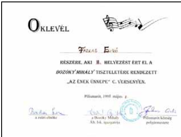
Egy tíz évvel ezelőtt nyert oklevél

Valóban, mindegyikünk szép, tiszta énekhangot örökölt, amit elsősorban édesapánknak köszönhetünk, ő énekelt is a rádió gyermekkorában. Úgy tudom, hogy az én éneklésemre az óvodában figyeltek fel az óvó nénik. Ők hívták fel anyukám figyelmét: „Ezzel a hanggal kezdeni kell valamit!” Ahogy az lenni szokott, sokat szerepeltetek később az iskolában is. Valahogy így kezdődött, hogy a sokféle próbálkozás mellett végül is az éneklés felé fordult igazán az érdeklődésem.