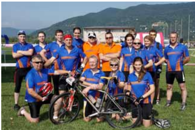
A Migreen Team csapata

Az idén csapatunk létszáma ismételten növekedett, így már majdnem harminc taggal kezdtünk neki az idei kerékpáros szezonnak. Szerencsére a támogatóink sora is bővült, akiknek nevei az egyesületi pólóinkon is díszelnek. Máris szeretnénk megköszönni nekik, hogy segítségükkel könnyebbé teszik a rendezvényeken való részvételeinket. Az UTILIS Kft., a Reneszánsz Étterem, a Hotel Honti, az Ételbárka Visegrád és a Visegrád SE támogatását élvezhetjük a 2009-es esztendőben. Az idén már több Maraton-versenyen szerepeltünk, elég nagy létszámmal.