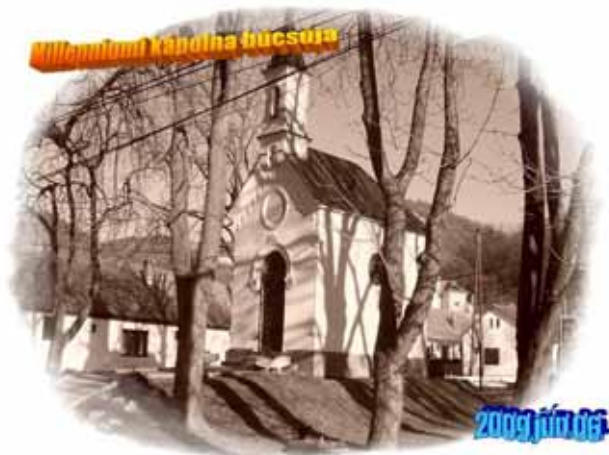
A Millenniumi-kápolna szerényen bújik meg a fák alatt