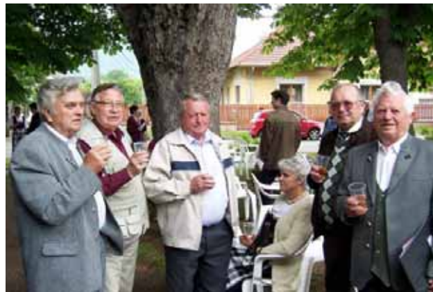
Kellemes a diskurzus a fák alatt pohárral a kézben