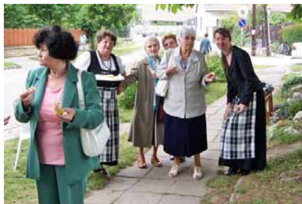
Oldott hangulatban: jól esik egy kis sütemény és üdítő: az énekkarosok kínálják a vendégeket