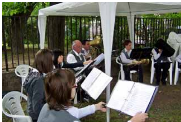
A mise elmaradhatatlan része: a zenekar hangol a sátor alatt