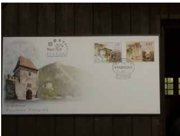
Szebbnél szebb bélyegeket láthattunk a visegrádi bélyegkiállításon