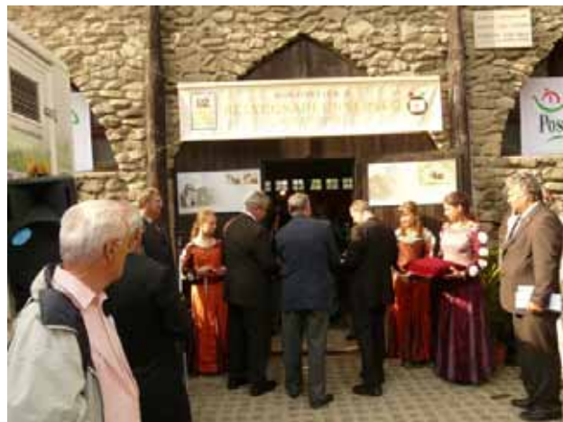
A nemzetközi bélyegkiállítás megnyitója