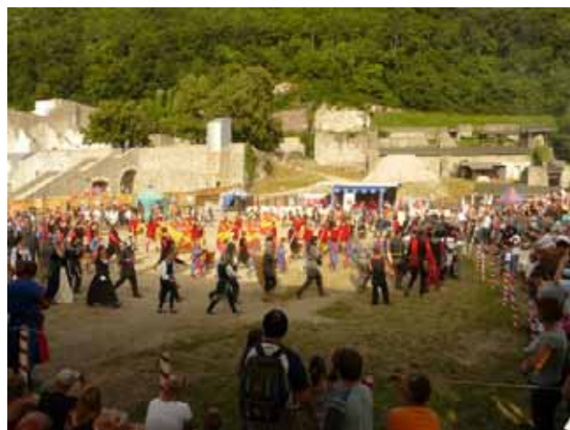
A palotajátékok az idén is sok nézőt vonzottak

Visegrád Város Önkormányzata ezúton fejezi ki köszönetét azon háztulajdonosoknak, akik a millenniumi év alkalmából házukra Visegrád zászlaját kifüggesztették, ezzel is emelve a jubileum méltóságát!