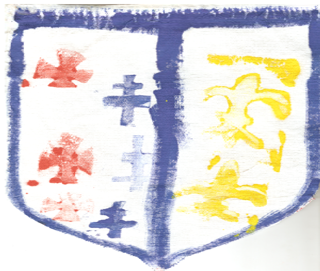
Pajzs a 21. századból

hogy a kólapot szimbolizáló kis textiltéglázat soronként felragasztva valóban a várfalat varázsolja majd elénk. És közben hallok a történetet, ahogy az óvo nénik segítik a gyermeki fantázia megindulását, ahogy a festés, ragasztás és beszélgetés közben kialakul minden gyermek saját várvédő története.