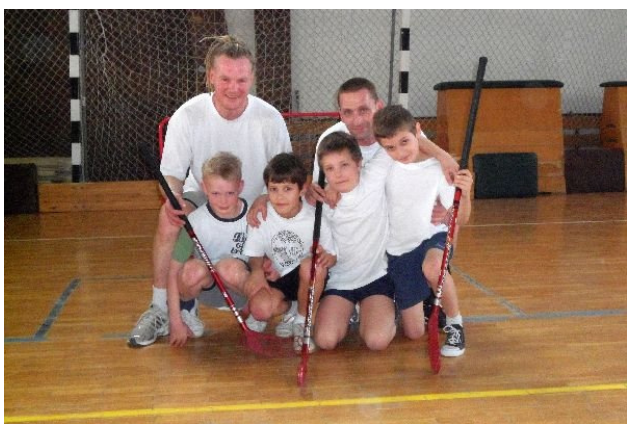
Ralf és a kicsik

Már régóta terveztem, de valamiért mindig elmaradt. De végül is idén márciusban már megrendezésre került az I. floorball kupa. Mint – szinte – mindenben, itt is nehezen gyülekeztek a csapatok, de végül is szép létszámú nevezés (9 csapat) után kezdődhetett a szombati program. Két csoportban zajlottak a küzdelmek, s a csoportok első két helyezette játszott a döntőbe jutásért. Nagyon jó volt látni, hogy az alkalmilag összeállt csapatok, baráti társaságok milyen jól érezték magukat. Együtt játszottak anyukák, apukák, gyerekek, nagyobb testvérek és a mérkőzések után a mosoly volt a legjobb főkmérő, hogy milyen is volt a hangulat. Aki eddig nem ismerte ezt a játékot, egy-egy meccs után kapkodva szedte a levegőt – de aki ismerte az is! Külön öröm, hogy Esztergomból, Pilismarótról és Kisoroszból is érkeztek játékosok (csapatok)!