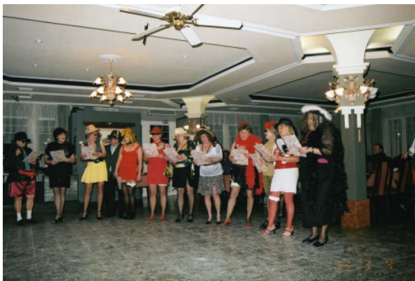
Az őszi szakma kitüntetettjei. Nem csak 18 éven felülieknek!