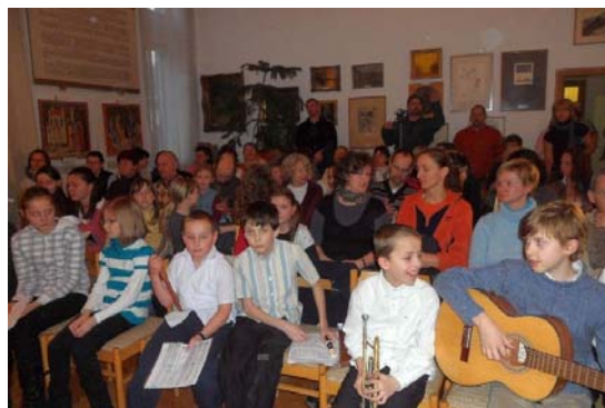
Szereplők és hallgatók