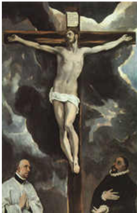
El Greco: Krisztus a keresztfán

Mindenkiben él egy dédelgetett gondolat, egy reménységár arról, hogy mi lesz a halál után. „A halál nem más, mint egy álom, amelyből a másvilágon boldogan ébred fel a lélek. A halál egy keskeny híd, vagy alagút, amely összeköti a földet a túlvilággal. A halál egy csónak, amelyben átrintgatja magát a testtől megszabadult lélek az örökkévalóságba.”