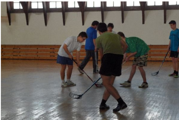
Folyik a küzdelem

Szeretném megköszönni mindazoknak a segítséget, akik lehetővé tették, hogy nevezési díj nélkül rendezhettük meg a kupát, és azoknak is külön köszönet, akik abban