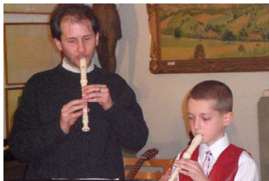
Tanár és tanítvány játéka