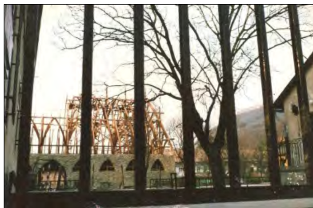
Készül a tornacsarnok ácsszerkezete (1988)

Bármelyik munkafeladatot idézem most fel bármelyik építkezésről, az összehangolt egymásra figyelés, az egymásra utaltság és az egymásra számítás biztonsága süttött át, nyilván a minden szakmát megtanulható szakmai fogások, a mesterség csínját-bínját elsajátítható tudás mellett. Bizonyítottá vált előttem, hogy az együttműködés élet-halál kérdése is!