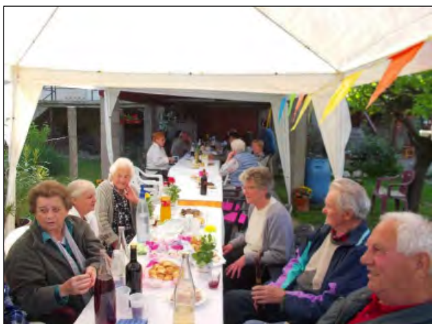
Terefere a sátor alatt

Immár harmadik alkalommal rendeztük meg május 7-én az újtelepiek (Harangvirág, Vadrózsa, Duna u.) jó szomszédi találkozóját. A találkozások apropóját az adja, hogy egybe gyűljünk, beszélgessünk egymással, és jól érezzük magunkat.