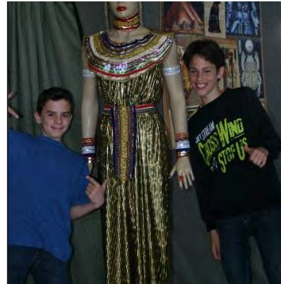
A fáraó felesége társaságában

A felső tagozatosok történelmi élményprogramban vehettek részt május elején a sportsarnokban. Olyan témát választottak a szolgáltatók, ami sok diákot érdekel: az ókori Egyiptomot .