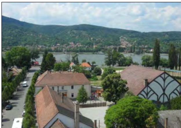
Az Áprily Lajos Általános Iskola és a Magyar László Tornacsarnok épületgyűjtése

„Aki hisz a pedagógiában, az csak optimista lehet. A pedagógus hit, mely inkább a természet, mint nézet dolga, kettőt tételez fel: hogy az emberek (az eddiginél különböző) nevelhetők s hogy (az eddiginél többre) taníthatók.”