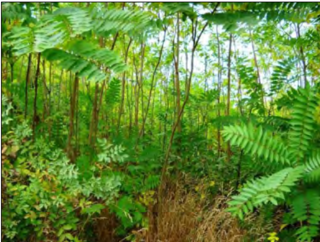
Bálványfa kezelés előtt...

Az idegenhonos fajok általában egy adott ökoszisztémában elpusztulnak, vagy nem válnak inváziós fajjává, hanem beilleszkednek az őshonos fajok közösségébe. Egy-egy esetben azonban hirtelen és tömegesen képesek a fajok elterjedni (ezeket hívjuk inváziós vagy özönfajoknak), felborítva a meglévő ökológiai egyensúlyt. Ennek következtében új egyensúlyi helyzet alakul ki, amely során az inváziós fajok kiszoríthatnak őshonos fajokat (például elfoglalják életterületüket), és azok így kihalhatnak.