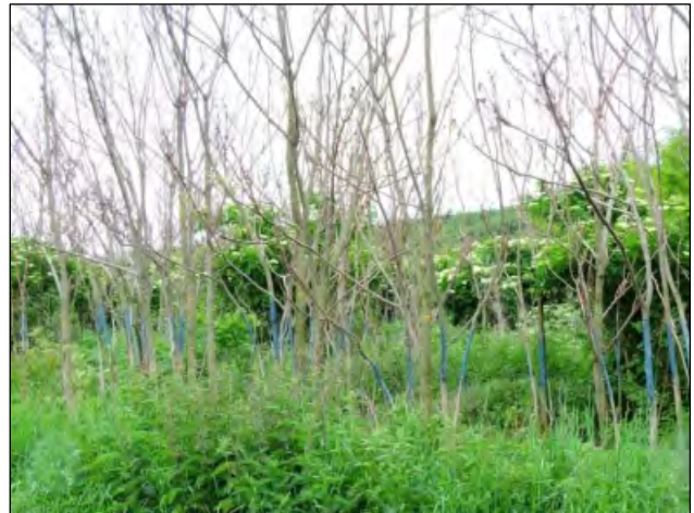
... és után

A Pilisi Parkerdő Zrt. szakemberei többek között Visegrád térségében kezeltek bálványfa-állományokat, és már a 2016-os év során is többször kérték a segítségüket.