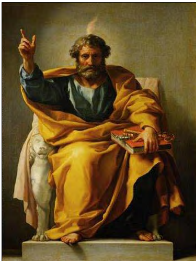
Péter apostol mint a kulcsok őrizője (Anton Raphael Mengs 1776/1779)

A visegrádi katolikus templom is az ő szent nevét viseli.