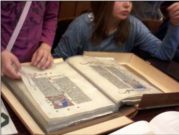
Lapozgatjuk a Képes krónikát

A vezetés csúcspontja a messzi raktárakból a könyveket elővarázsoló elektromos könyvlift kipróbálása volt.