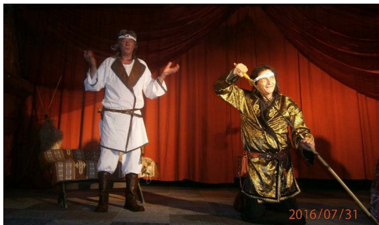
Részlet az előadásból