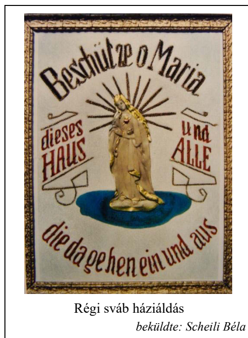
Régi sváb háziáldás