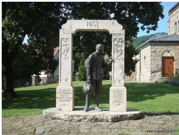
Kitelepítési emlékmű, Dunabogdányban