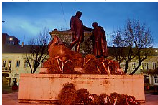
Fadrusz János zilahi szobra

Kedves Gyerekek! A pesti árvíz legendás „árvízi hajósa” nemcsak e tettéért vált a magyar történelem kiemelkedő személyévé, hanem az 1848-as forradalmat előkészítő reformkornak Széchenyi Istvánét meghaladó radikális nézeteiért (jobbágyfelszabadítás, sajtószabadság) is