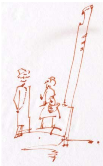
Találkozunk a piacon?