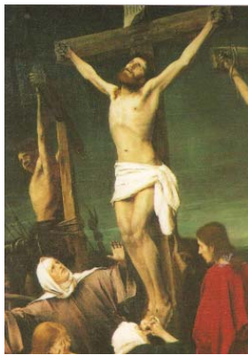
Munkácsy Mihály: Golgota (részlet)