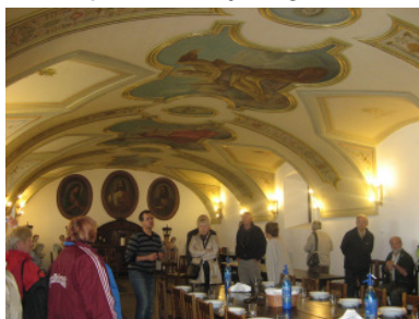
A refektóriumban hallgatjuk az ismertetést

Ha május, akkor kirándulás! Nem volt ez másképp idén sem: az Együtt Kulturális Egyesület 60 fős csapattal – bogdányi barátainkkal együtt – járta meg május 25-én a déli régió fővárosát, Szegedet és a vajdasági Szabadkát.