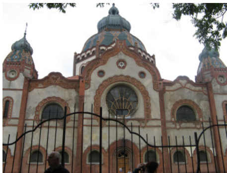
A zsinagóga Szabadkán

Városnéző sétánk során nagy tömeg volt az utcákon: aznap rendezték a hídi vásárt. A napsütéses forgatagban lesétáltunk a Fogadalmi templomhoz. Belső látványa sokadszor kápráztatott el: az élénk színben pompázó dóm hatalmas méretei mellett törpének éreztük magunkat. A téren álló régi Dömötör-tornyot is körüljártuk, majd a séta után egy Tisza-parti halászcserda volt célpontunk, ahonnan a Maros beömlésére is ráláttunk. Ízletes szegedi halászlé és túrós csusza, illetve erőleves és cigánypecsenye közt választhatott az éhes kiránduló.