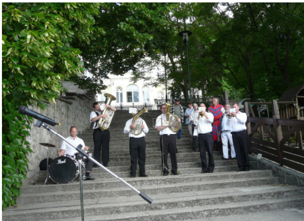
A zenekar a Görgey-indulót adja elő

Talán furcsának tűnhet, hogy ilyen későn számolunk be két visegrádi megemlékezésről, de mind a kettő a júniusi lapzárta után volt. Hogy mégis megteszem, annak jó oka van, ugyanis Visegrád szempontjából mindkettőn véleményünk szerint érdekes és jelentős dolog történt.