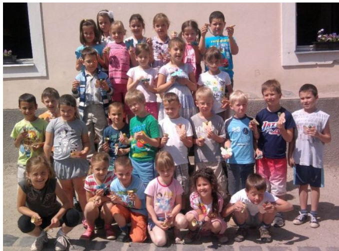
Íme, a következő első osztály – teljes létszámban

Úgy látjuk, hogy várják az iskolát, ami bizony nem jelent mást a szakemberek szerint, minthogy iskolaérettek lettek.