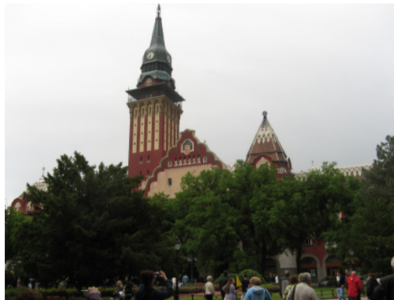
A szabadkai városháza

meg először szakavatott idegenvezetővel, aki a helyi zsidóság és az épület nem kevésbé hányatott sorsával ismertetett meg. Mivel igencsak ritkán járunk ilyen épületben, különös élmény volt hallani a zsidó vallás és szokások érdekességeiről. Az épület a Világ Kulturális Örökségének része 1989 óta.