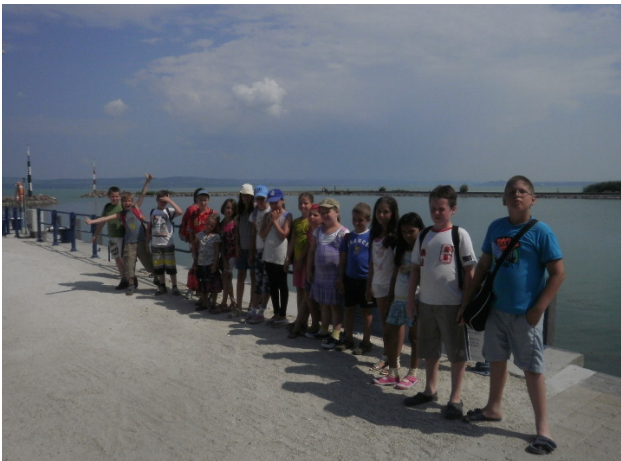
Csoportkép a Balaton-parton

Hol volt, hol nem volt, volt egyszer egy okos csoport. Ez a csoport a Pillangó gyermeküdülőben szállt meg Balatonszemesen . Az egyik nap felkerekedtek és hajókázni indultak. Miután mindenki felszállt a hajóra, az elindult Tihanyba .