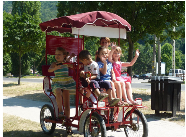
A bringóhíntózásnak nagy sikere volt a gyerekek körében

No és persze a szülőknél , hiszen minden napra akadt egy kis meglepetés: hol egy rekesz barack, hol egy-két dinnye, amit szívesen fogyasztottak a gyerekek a kánikulában.