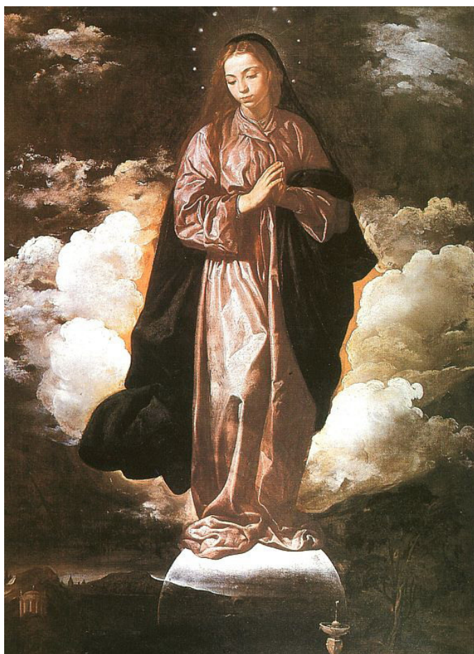
Diego Velázquez: Szűz Mária

Kisboldog asszony napja egy katolikus egyházi ünnep, amelyet minden év szeptember 8-án, vagy valamelyik hozzá közel eső vasárnapon tartanak. Ez a nap egyben Szűz Mária születésének ünnepe is. A hagyomány szerint Mária születése a jeruzsálemi Bethesda-fürdőnél történt.