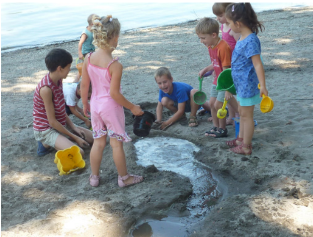
Homokvárépítés a kertben – pancsolással egybekötve

Ez a nyár azonban rendhagyó volt, mert az árvíz olyan pusztítást végzett a kertben, hogy nem tudtuk használni a közel negyven kisgyerekekkel. Éget a nap, csíp a szúnyog, az épület is meleg (egyébként sem lehet egész nap bent lenni), a Duna-part szennyezett... hová menjünk?