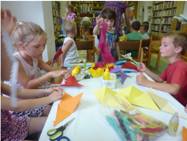
Elmélyült alkotómunka: kézműves foglalkozás a könyvtárban

Ez azt jelenti, hogy már reggel a kertben gyülekezünk, ott reggelizünk, kézműveskedés, rajzolás-festés-gyurmázás-agyagozás... és még sok minden más elfoglaltság várja a gyerekeket. Hatalmas homokvárakat építenek, pancsolásra is van lehetőség, és mielőtt ebédelni megyünk, minden gyereket lefürdetünk, hogy jól tudjon pihenni.