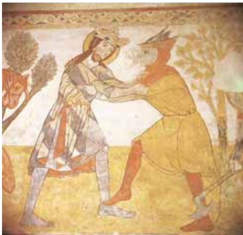
Törábrázolás a kakaslomnici templom Szent László-legendáján, 14. század eleje

A középkori Magyarországon a törhasználatra vonatkozó adatok inkább a 14–15. századra jellemzőek. A fentebb már említett, 14. században is ismert bicellus valószínűleg a 15. századra terjedt el széles körben és vált kommersz, hétköznapi fegyverré. A tört megemlíthetjük a gyakran használt paraszti fegyverek között is. A városi polgárság testamentumaiban, mustrajegyzékeiben, hagyatéki leltáraiban a főbb fegyverfajták között szerepel. Az Anjou-kortól kezdve mind több adat szól a hétköznapi élet hatalmaskodásairól, ahol a küzdő felek töröket is használnak.