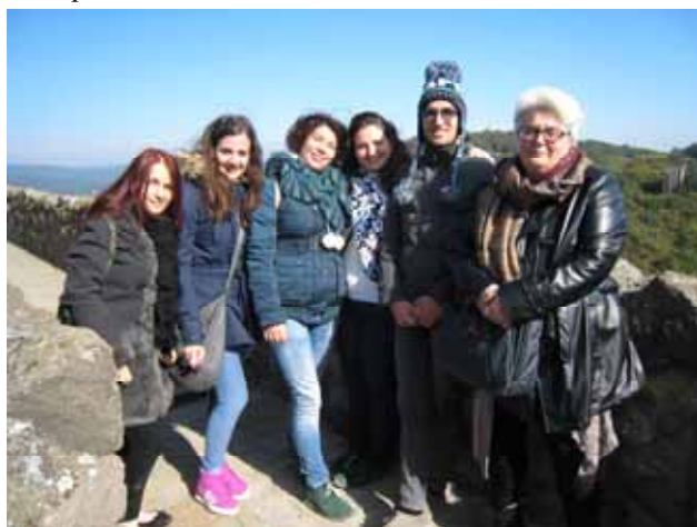
Az énekesek és tanáruk a várban

Szép zenei élményben volt része annak, aki meghallgatta olaszországi testvérvárosunkból, Lancianóból érkezett fiatalok bemutatkozását. Október 5-én, szombaton délután az impozáns Palotaházban került sor a koncertre.