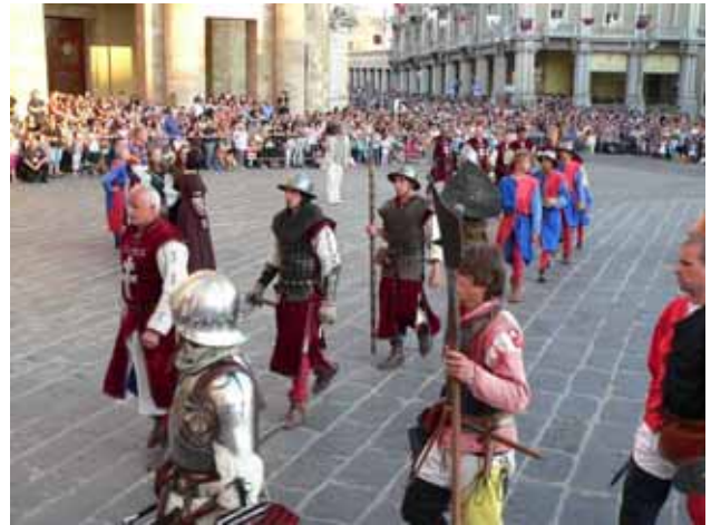
Csapatunk bevonul a Fő térre

köszönhetően a gazdasági nehézségek ellenére is sikerült színvonalas programot megvalósítani Lancianóban.