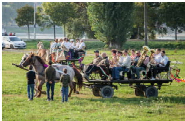
Ének- és zeneszó