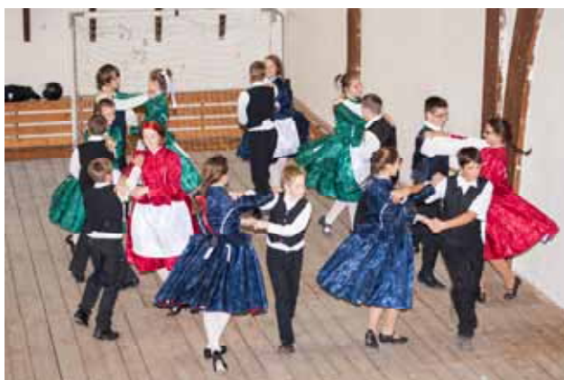
Iskolásaink sváb tánca