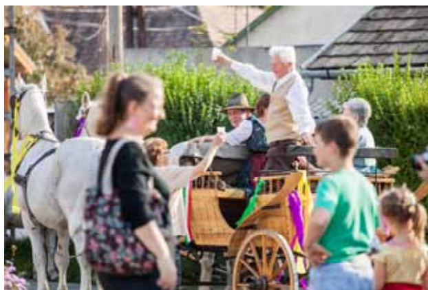
Már jó a hangulat