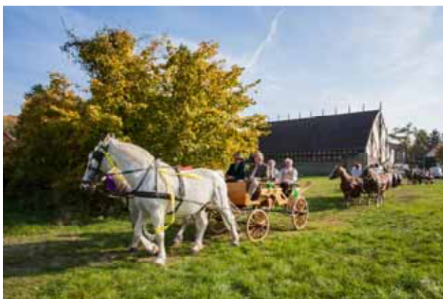
Indul a szüreti menet