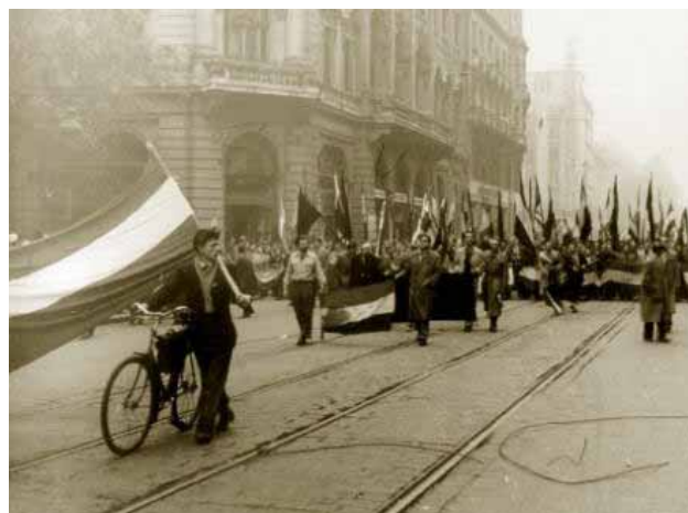
1956. október 23-án a fővárosból indult el a függetlenség és szabadság vágyát zászlajára tűző forradalom és szabadságharc országos hulláma

A jelenlévők felszólalásaikkal is tanúsították, hogy Visegrád sem kér többé a diktatúrából, s hogy demokratikus, független Magyarországon kíván élni.