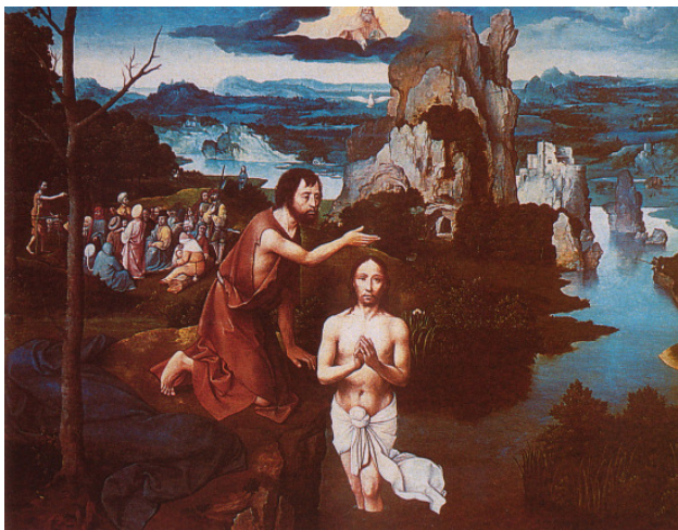
Joachim Patinir: Keresztelő Szent János megkereszteli Jézust a Jordán vizében

Január 6.: Vízkereszt. A vizek megszentelésének napja.