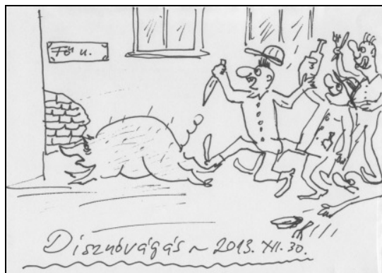
(G. P. karikatúrája)