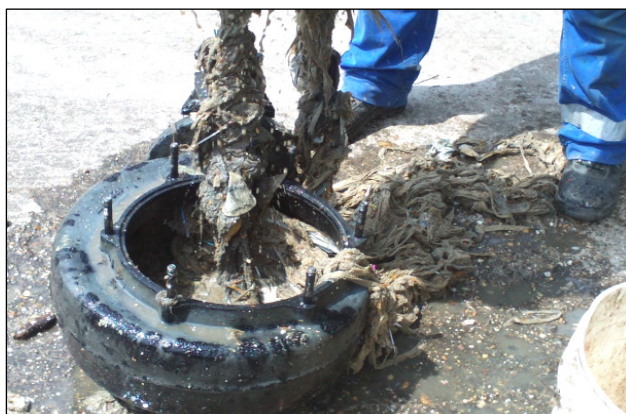
Az átemelő szivattyú meghibásodása szálas anyag miatt

A szennyvízátemelő- és egyes tisztítótelepi berendezések rendszeres üzemzavarához vezetnek a közcsatornába juttatott csatornaidegen, illetve szálas anyagok. Ezek elsősorban a bekerülő textíliákból (ruhaneműk, felmosó és egyéb takarító rongyok, nedves törülközők stb.) származnak, melyek a csatornába jutva nem bomlanak le, összegyűlve pedig feltekerednek a szivattyú járókereire, melyek azok meghibásodását okozzák.