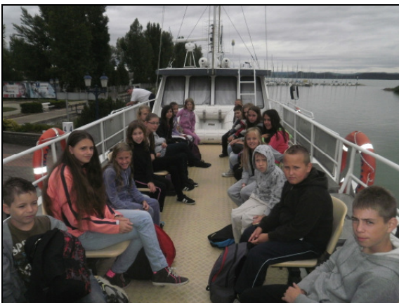
Hajózáás a Balatonon

Az anyagi hozzájárulást nem igénylő kikapcsolódás és élményekben teli feltöltődés part közeli kőépületben történő elhelyezés mellett teljes ellátást tartalmazott.