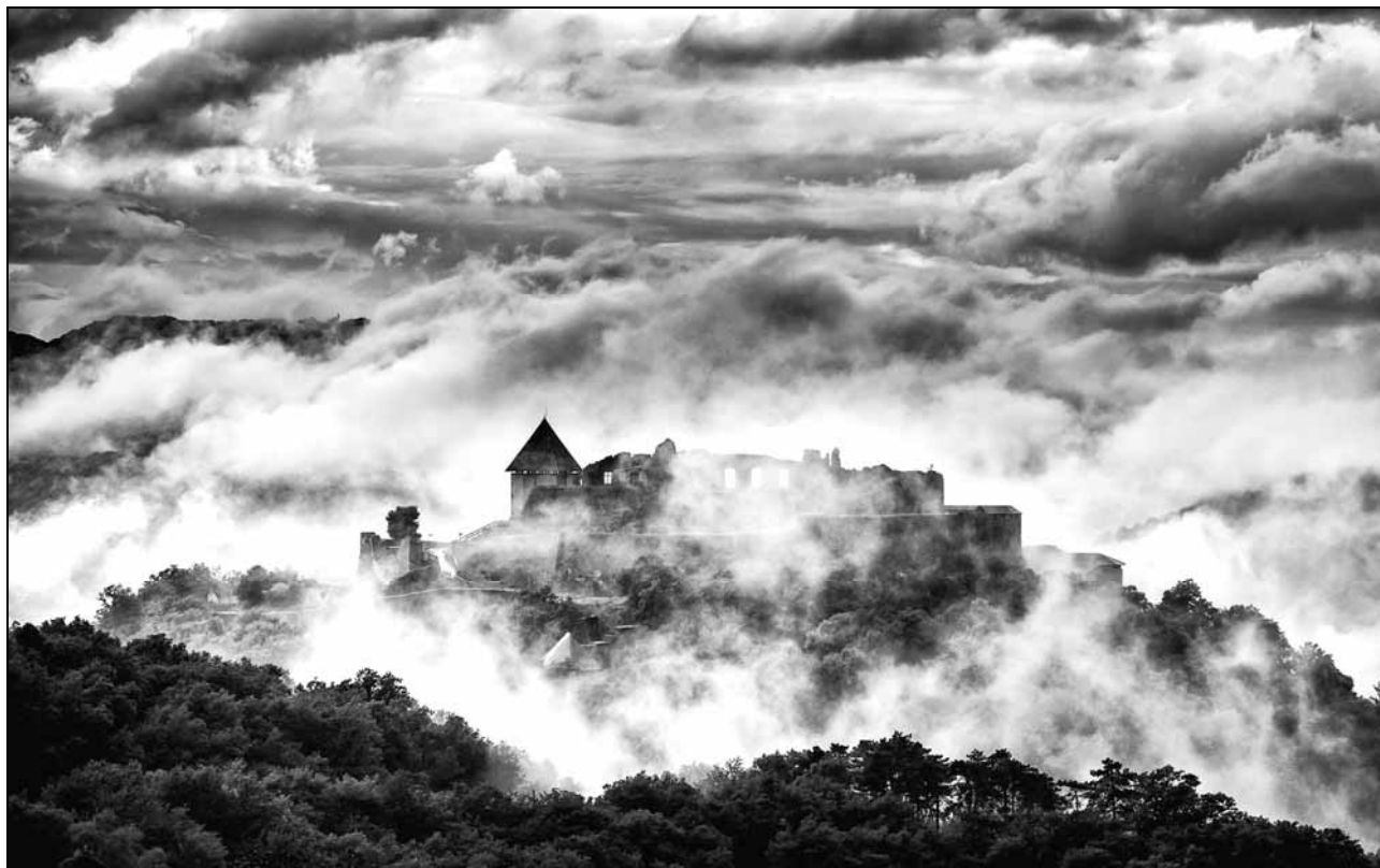
A visegrádi vár téli ködben