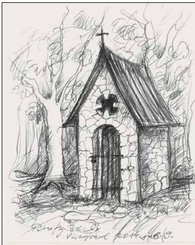
Péterfy László 2014 nyarán visszaemlékezésből készített rajza a kápolnáról