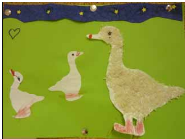
Ügyes kezek munkájának egyik eredménye

Az egyik teremben kézműves tevékenység folyt, természetesen libát készítettünk. A második helyszínen libás ügyességi játékokat játszottunk, a harmadikon libás körjátékokban lehetett részt venni. Minden gyermeknek lehetősége volt mindhárom tevékenységet kipróbálni.