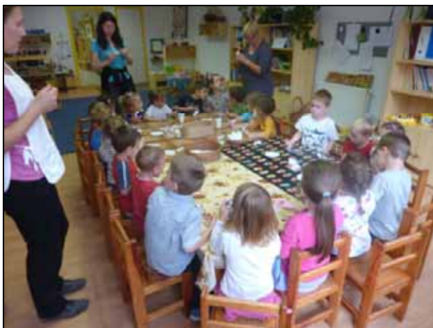
Szorgos apró kezek kézműves foglalkozáson készítik a kislibákat

„A bornak Márton a bírója” – tartja a hiedelem, azaz ezen a napon a bort mindenképpen meg kell kóstolni. A must ilyenkor változott borrá, az egész évi fáradozás gyümölcse ekkor mutatkozott meg, az eredménnyel pedig szívesen el is dicsekedtek a boros gazdák. Természetesen mindezt az óvodában csak elmesélték az óvó nénik, és a középsősök össze is kapcsolták a néhány hete látottakkal, amikor Johann bácsi pincéjében ismerkedtek a borkészítés eszközeivel.