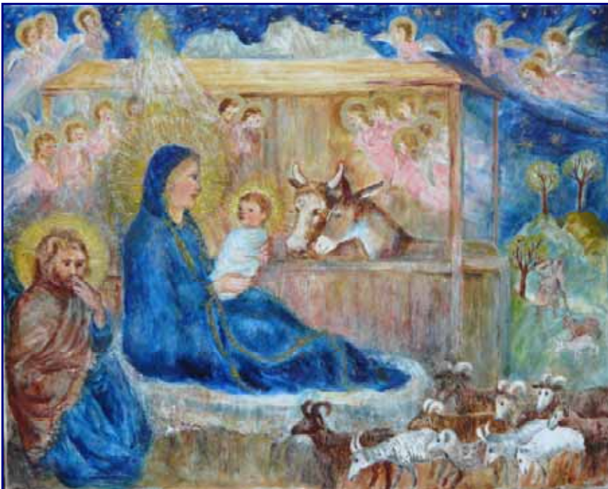
Betlehemi jászol (G. Nagy Nóra festménye)

Áldott, békés karácsonyi ünnepeket és boldog, sikerekben gazdag új esztendőt kíván minden kedves Olvasójának a harmincéves Visegrádi Hírek!