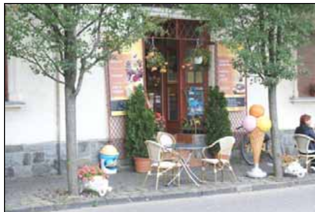
A Rigoletto cukrászda utca frontja

RIGOLETTO CUKRÁSZDA Rév utca 9. alatti utcai bejárata