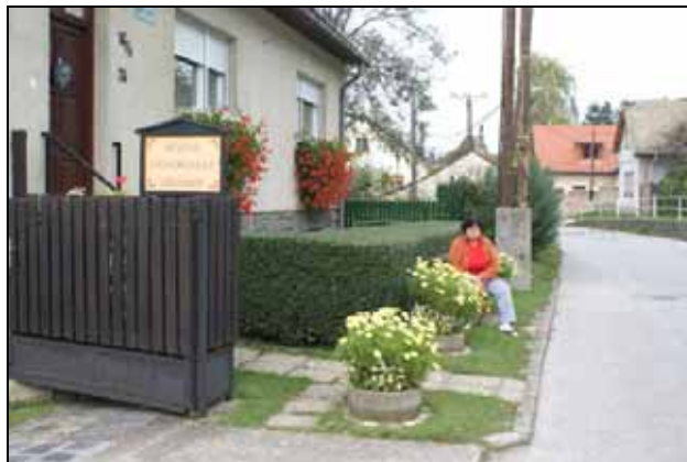
Rózsika virágos balkonú háza előtt

SCHÜSZTERL KÁROLYNÉ RÓZSIKA Széchenyi utca 24. alatti virágos utcafrontja, balkonja