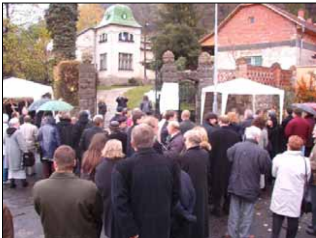
Az emléktábla avatása 2004. november 13-án

Tíz évvel ezelőtt a VSZ megalakulása után rögtön ez volt az első jelentős szervezés, amelynek keretében emléktáblát avattunk tiszteletére.