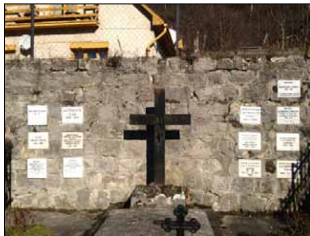
A Latinovits család sírkertje a visegrádi temetőben