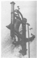
Áprily Iskoláért Alapítvány

„Lobogjon” a zászló Visegrád utcáin, terein hivatalos zászlóink mellett „visegrádi zászló” is!