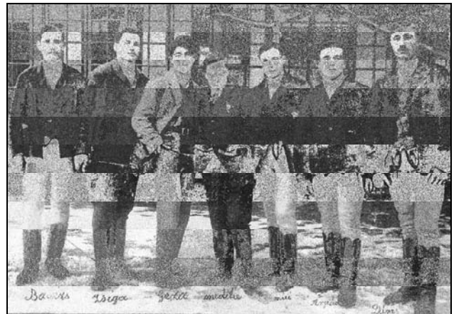
Újévköszöntő ifjak 1927.