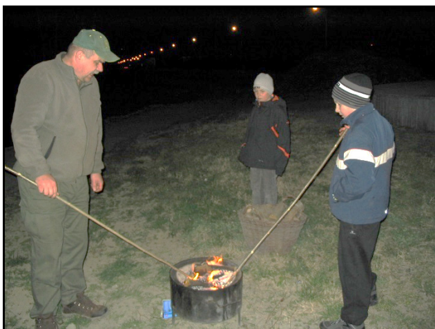
A legények a tűzben izzítják a korongokat