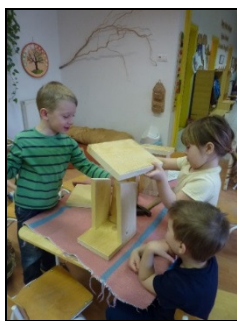
Készül a madárodú

Az óvodában a tervezett tevékenységekhez kapcsolható a környezet szeretetére nevelés. Mindezt a gyermekek legfontosabb tevékenységéből, a játékból kiindulva könnyen meg lehet valósítani egy jól kialakított óvodai veteményes kertben is. A mi óvodánkban a középső csoportosok feladata minden évben a veteményes kiskert gondozása. A munkákhoz gyermekek kezébe való új szerszámokat szereztünk be, és ha az időjárás is megengedi, kezdődhet a munka. Évről évre nagy öröm felfedezni az elsőként kibújó palántákat, hagymácskákat és megfigyelni napról napra a növények változását az első hajtásoktól a betakarításig. Amikor a kisgyermek saját maga ülteti el a salátapalántát, a dughagymát, a retket, a paradicsomot és neveli, gondozza a kertben, majd a termését betakarítva közösen salátát készítenek, vagy a tízóraihoz, uzsonnához fogyasztják el, akkor ebből a sok új ismeretből gazdagodnak. Az ültetés, locsolás közben a száraz vagy a nedves talajt megtapintja, tapasztalatokat szerez, a kertészkedéssel jól formálható a figyelem, mivel megfigyelheti a növények növekedését, gyomot irt, figyel a virágzást, a termést, ezáltal talán megsejt valamit a természet nagy körforgásából.