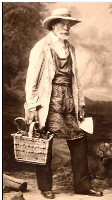
Görgey kertészruhában. A fotográfia feltehetően Koller Károly tanár pesti műtermében készült

Az év jó részét Visegrádon töltő Görgeyt a közéletől elvonult, a kiegyezésbe belenyugvó, csak kertészkedéssel és gazdálkodással foglalkozó öregúrként igyekezett beállítani az akkori média a közvélemény számára. Erre példaként szolgált az a hír, amely a Fővárosi Lapok 265. számában (1892. szeptember) jelent meg, hogy Görgey „egy tálca pompás gyümölcsöt” küldött az akkor Visegrádon az erdőszlakban (Fő u. 41.) tartózkodó öfelseje számára. Görgey hiába írt rögtön cáfolatot a lap főszerkesztőjének, Vadnay Károlynak , ez a kitalált hír a későbbiekben mint megtörtént esemény bekerült történetírásunkba is.