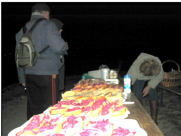
Vendégeinket zsíros kenyerek várták