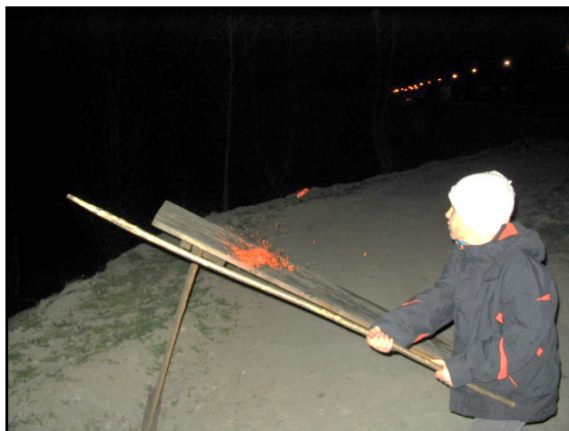
Ütés után szikrák repkednek a palánkról