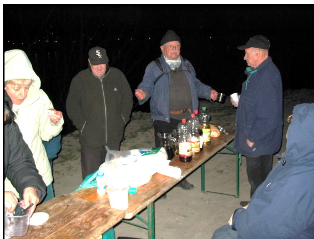
Közben az étel-ital is fogyott