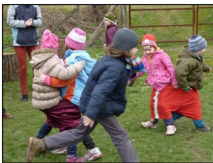
Gatya-fogó a kertben

Ebben a látványban szeretnénk mi is gyönyörködni, és reméljük, ezekhez a madárfürdőtökhöz nem csak a madarak szoknak hozzá, hanem a pillangók is, így az óvodánkba járó gyermekeknek még több élményt tudunk nyújtani. Éppen úgy, mint a téli etetés során, folyamatosan ügyelni kell a víz utánpótlására, mert a madarak megszokják, és nem keresnek maguknak más fürdési lehetőséget. Mindezzel szokás kialakítására, gondoskodásra is neveljük a gyermekeket. A madarak kertünkbe való odacsalogtatására elkészíteltük az odúk is, melyek szögelésében mindhárom csoport részt vett.