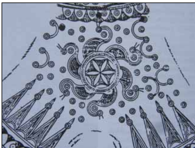
Lóporszaru karcolt mintája pásztorokészségről: a forgóróza a Tejútközpont jele

Igaz út, keskeny ösvény, rögös út a neve a nép nyelvén az életútnak, melyet végigjárni bölcsék, öregek segítenek. A mese az örökléthe vezető tudás tiszta útja: a mese hőse elindul világot látni. Mi történik útközben vele? Kik segítenek, milyen próbákat kell kiállnia, és főként: sikerül-e neki a világlátás? A világ szó a magyarban világozást, fényt is jelent... A népmese vezet, megnyitja az elmét, az íhletett, áhítatos állapotban ki-k magával találkozhat. Ha akar.