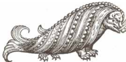
A 17. században ilyennek vélték a cetet

Egy hajótiszt felmászott a legmagasabb árboc tetejére erősített hajókösárba, ahonnan látcsővel a horizonton végigtekintve bálna után kutatott. Amikor megpillantott egyet, csónakot irányított oda. A bálnának jó a hallása, és már a legkisebb gyanús zajra alábukik, ezért a csónak csendben közeledett. Az öreg, tapasztalt szigonyozók többéves gyakorlat alapján legtöbbször már előre sejtették, hogy az állat hol bukkan a felszínre. Ilyenkor az evezősök kétszeres erővel dolgoztak, hogy a csónakkal a lassan felszínre emelkedő bálna mellé érkezzenek – sokszor ez olyan jól sikerült, hogy csaknem súrolták a hatalmas testet.