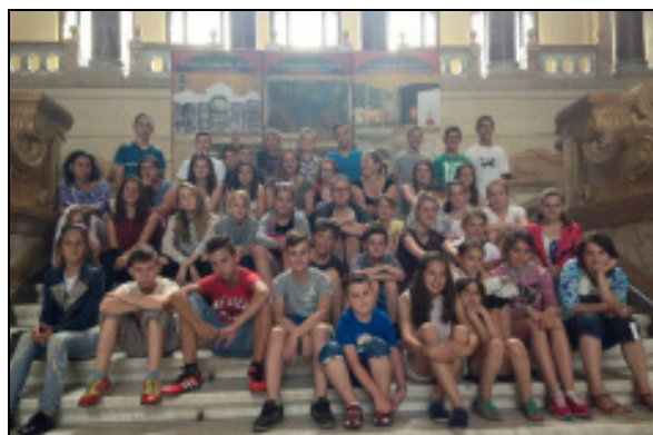
A VI-PA-tábor résztvevői a Néprajzi Múzeum lépcsőjén

A VI-PA-tábor szervezői nevében köszönjük mindazoknak, akik érdeklődésükkel, támogatásukkal, munkájukkal segítették a tábor lebonyolítását, a feltételek maximális biztosítását; köszönjük a családoknak a vendég gyermekek szeretetteljes fogadását, ellátását: az Áprily Lajos Általános Iskola és Alapfokú Művészetoktatási Intézmény , az Áprily Iskoláért Alapítvány és a szülői szervezet