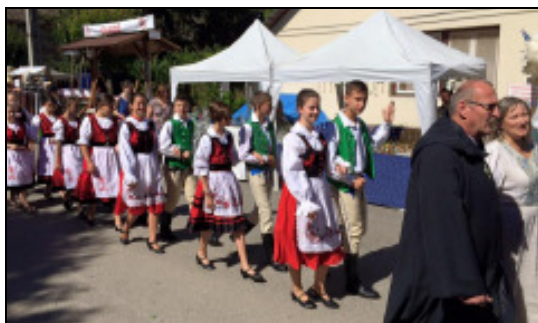
A hagyomány jegyében: felvonulás a palotajátékokon igazgatóinkkal