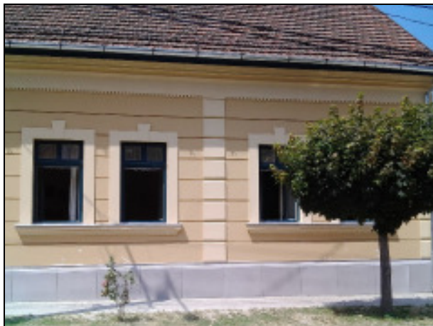
Az óvoda felújított homlokzata