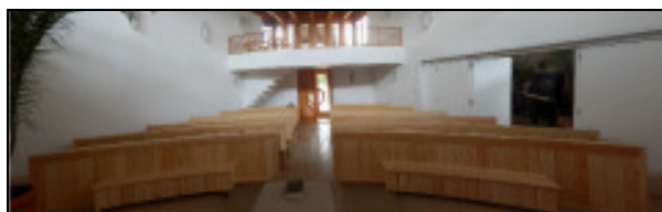
Templombelső az új padokkal

A helyes stratégia: A közösség bibliai alapú eszményképének megformálása. Itt a legfontosabb: az Úr napjának megszentelése, az istentiszteleten való részvétel. Felépült a templomunk jól látható helyen, a Duna partján, adatott harangunk, melynek hívó hangja az egész városban hallható. A templomépület-együttes a program megvalósításával alkalmassá vált a gyülekezeti élet kiszolgálására: megfelelően berendezett szakrális tere méltó helyszíne az istentiszteletnek és egyéb ünnepi alkalmaknak (esküvők, konfirmáció, presbiteri konferenciák stb.). Az imaterembe visszahelyeztük a székeket, melyek eddig a templomteret szolgálták.