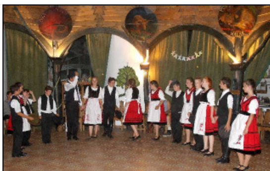
A táncsoport a barátságesten