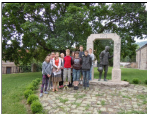
Hatodikosok a dunabogdányi emlékműnél