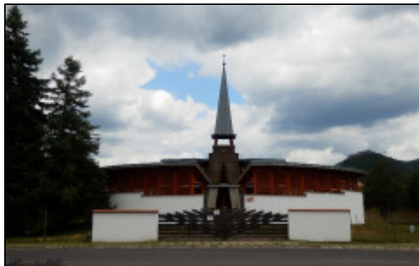
Templom és harangláb

A visegrádi templomépület-együttes építése 2002. évben kezdődött el. 2009. év tavaszára elkészült a templomtér karzattal, az imaterem, a lelkési hivatal, a kiszolgáló vizes helyiségek egy félköríves épülettömbben és a harangtorony a haranggal. 2009. június 1-jén, pünkösöd másodnapján dr. Bogárdi Szabó István püspök úr igehirdetésével felszenteltük a templomot.