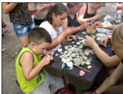
Kézműves foglalkozás a Telgárthy-réten