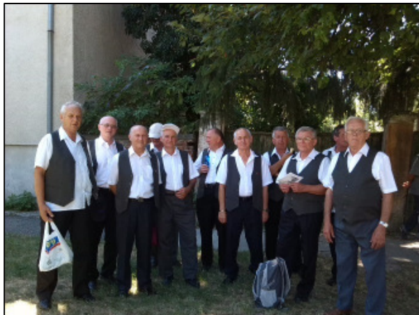
Dalköri tagok a váli fellépés után