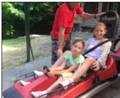
Bobozás a Nagy-Villámon