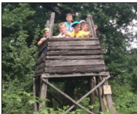
Magaslesen – valahol a Telgárthy-rét fölött