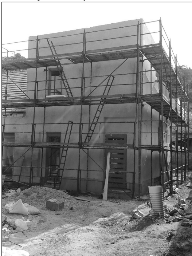
Gőzerővel folyik a munka

2015 májusában lezárult a polgármesteri hivatal befejező építési munkáira kiírt nyílt közbeszerzési eljárás, melynek nyertese a Halastó Camping Kft. (2085 Pilisvörösvár, Deák Ferenc utca 27.) volt, tekintettel arra, hogy ez a cég nyújtotta be a legalacsonyabb összegű ellenszolgáltatást tartalmazó árajánlatot. Június 9-én megtörtént a vállalkozási szerződés aláírása, majd néhány nappal később a kivitelező – miután elvégezte a szükséges felméréseket – megkezdte a befejezési munkálatokat.