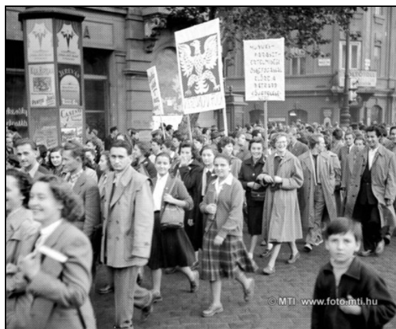
Lelkes ifjúság vonul a pesti utcán 1956 októberében