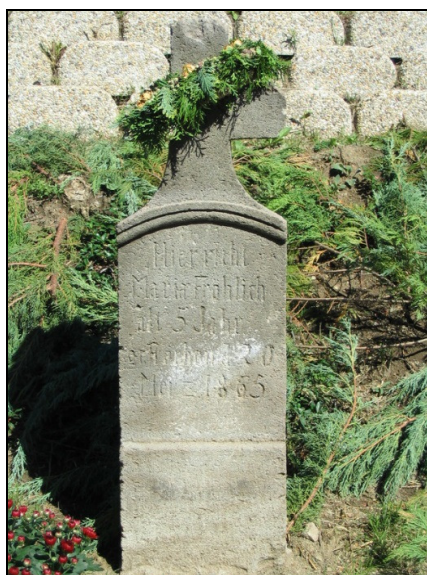
A felszentelt sírkő

újabb régi sváb sírkövel bővült, melyet szép számú érdeklődő jelenlétében Kalász István kanonok úr felszentelt.