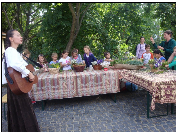
Jó volt együtt énekelni

Miközben szorgos kezek között az ősz színeiben pompázó asztaldíszek készültek, a háttérben szüreti népdalokat énekeltünk derűvel, bensőséges hangulatban, megörvendeztetvén egymást.