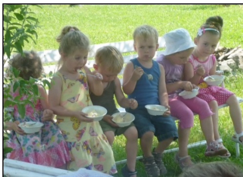
Jólesik a falat a nyár hevében