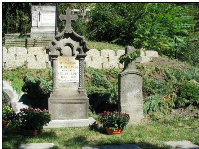
A sírkert őrzi őseink emlékét

Nemzetiségi ének- és zenekarunk a ceremóniánál közreműködött.