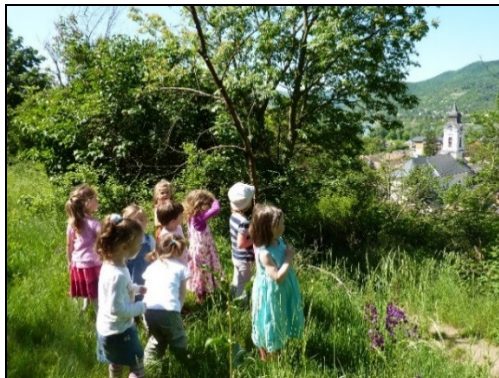
Kirándulás a Kálváriára