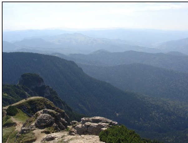
A Csalhó-hegység vonulatai

Utunk a Kárpátok hegyláncai között élő magyarokhoz, hegycsúcsokon át, kiemelt helyekre épített régi templomok, kolostorok, mesés várak, természeti csodák között vezetett.