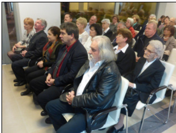
A díjazottak és az ünneplő közönség egy része