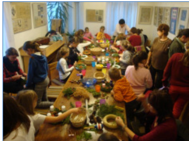
Szebbnél szebb adventi-karácsonyi díszeket készítettünk

Köszönjük a lelkesedéseket, érdeklődéseket!