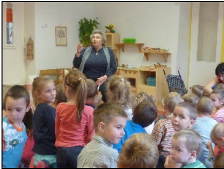
Nusi néni mesél az ovisoknak

Ismét egy programokban igen gazdag időszakot tudhatunk a hátunk mögött. Márton hete már önmagában is érdekes, izgalommal teli a gyerekek számára. Ez alkalommal még nemzetiségi tartalommal is színeztük. Kipróbálhattuk a tollfosztást , kukoricamorzsolást , képfestő mesterséget is. A tollpíhek ugyan csiklandozták a torkunkat, a morzsolás nem is olyan könnyű, de nagy lelkesedéssel műveltük mindegyiket – elkészült egy kispárna a babaszobába, a kukoricacsutkákból pedig babákat készítettünk. A képfestő nyomdázás végeredménye rozmaringgal töltött kis illatszákocská lett. Minden napra jutott egy különleges élmény.