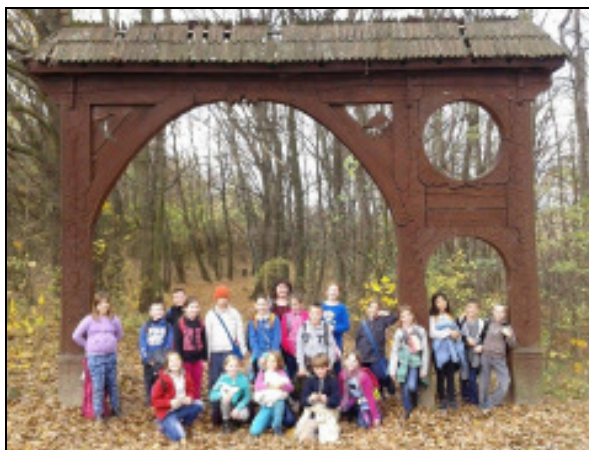
Csoportunk a székelly kapu előtt

A Mogyoró-hegyi Erdei Művelődés Házánál nagy szeretettel fogadták csoportunkat, amely idén a visegrádi negyedikes osztályból és a kisoroszi tagiskolánk alsós diákjaiból állt. A szakvezetők – és Panni kutyus – segítségével egy olyan csodálatos világba csöppentünk, amelyet talán magunktól észre sem vettünk volna, pedig azt hittük nyitott szemmel járunk. Szemet gyönyörködtető, szívet nyugtató volt a sokféle zöld látványa is magunk körül. Megismertettük velünk az erdő kincseit, barangoltunk vadvirágos réten, bemutattak az erdő fáinak, s fűben-fában orvosára leltünk.