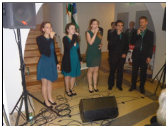
A Jazzation együttes színvonalas műsort adott