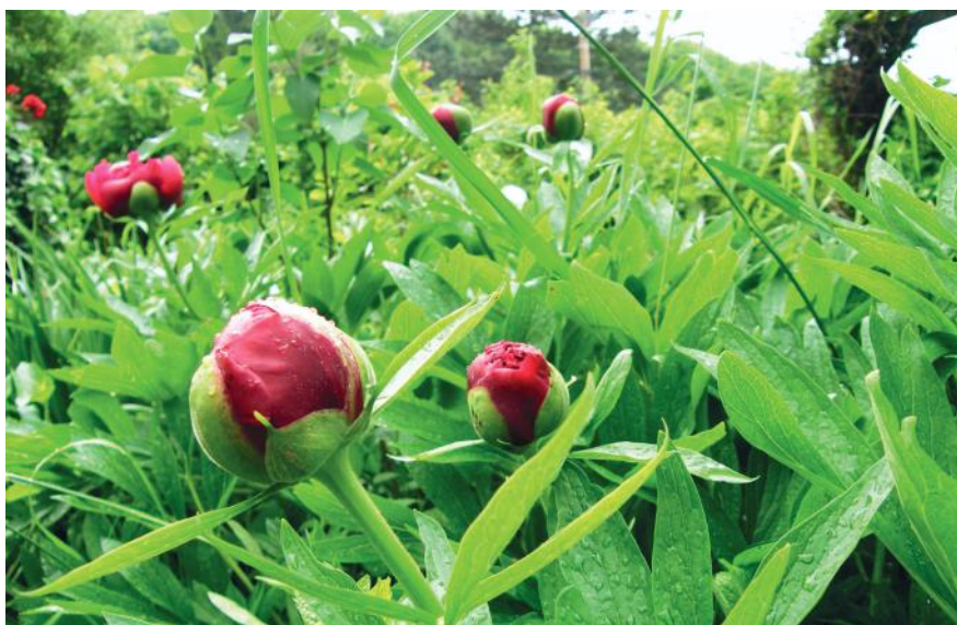
A pünkösd rózsza kihajlott az útra