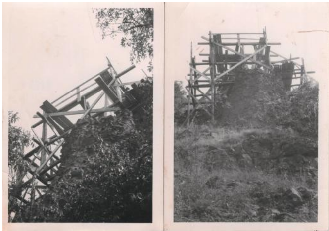
Az épülő Viktorin emlékmű 1969-ben