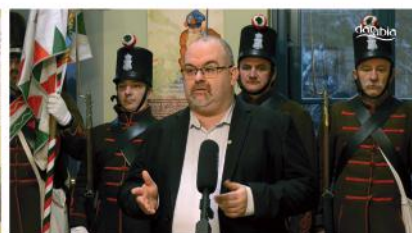
Kiállítás a 48-as veteránok gondozásáról és a Honvédmenház történetéről

Adásunk fogható a Magyar Telekom IPTV-rendszerén a 260-as csatornán. Minden nap 16 órától visegrádi eseményt közvetítünk! Műsorismertetés minden óra 55 perckor látható a képernyőn. Elérhetőségeink: danubiatv@gmail.com, 06-70-940-5034. Műsoraink visszanezhetők weboldalunkon is: danubiatv.hu