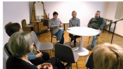
Idősek karácsonya, A Német Nemzetiségi Önkormányzat közmeghallgatása