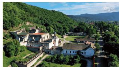
Szentmise, Adventi vásár, Hírösszeállítás a 90 éve alapított Mátyás Király Múzeumról