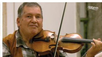
A M.É.Z zenekar koncertje