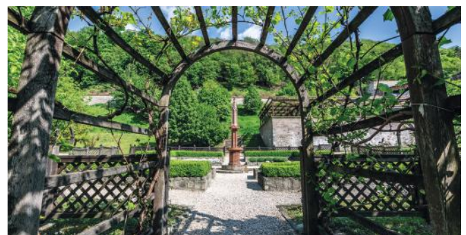
Fotó: Greguss Tamás