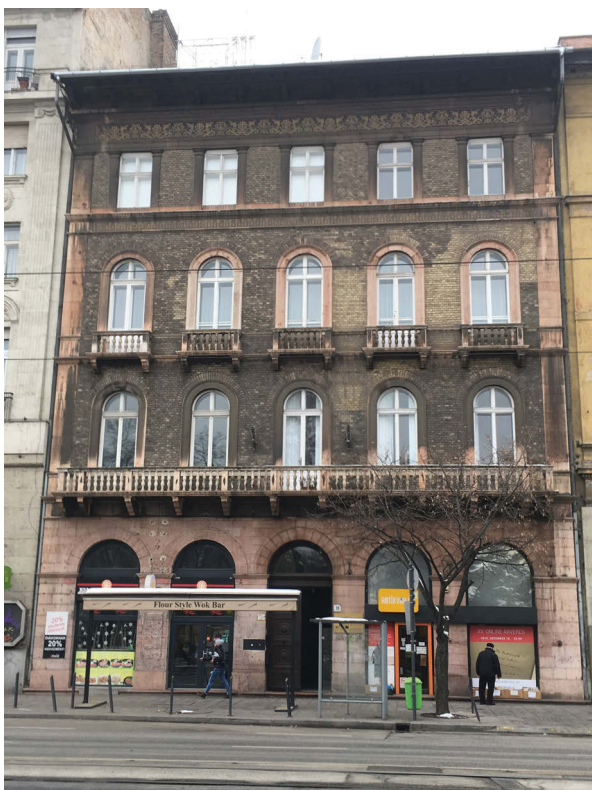
Múzeum körút 39.sz épület, amelynek az erkélyéről üdvözölte Görgei a tisztelgő huszárokat.

Azt, hogy a film első felében olvasható feliratok tartalma és a képeken látható jelenetek nincsenek összhangban, már néhány évvel ezelőtt Pálffy Lajos publicista is észrevette. Kritikáját a MANDA honlapján 2016. június 5-én feltett „Hová lett a perzsaszőnyeges erkélyről a tábornok?” c. írásában közölte. A két különböző részből összeállított film készítője a Goldenweiser vállalat volt, és 1916. május 21-től, a tábornok halála napjától, „Epizódok Görgey tábornok életéből” c. kezdték vetíteni a mozikban. Nagyon valószínűnek tűnik, hogy a Görgei halála miatt megnőtt érdeklődést kihasználva a Goldenweiser vállalatnál meglévő két különböző témájú filmdarabot összeillesztették és feliratozták. Amíg a hajóútról szóló rész elfogadható felvételekkel készült, addig a huszárok felvonulását bemutató rész csapnivaló, mivel például az operatőr nem vette észre, hogy a katonaságot köszöntő tábornok és családja lemaradt a képről, az erkélyről, ahol a tábornok állt, csak a korlátra terített perzsaszőnyeg látható. A gyenge minőségű, két részből álló felvételhez készített feliratok is megtévesztőek, mivel nem a valóságot tartalmazzák. Az első feliraton szereplő