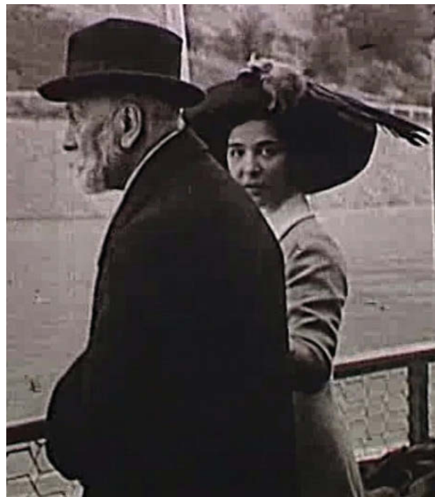
Görgei egy rokon hölgy társaságában a hajón.

A filmhíradó második felének harmadik és negyedik része a feliratok szerint Görgei „Hajón Visegrádra megy a családjához” és „Családja körében” eseménysort mutatja. Azt, hogy ezt a filmhíradó részletet mikor készítették, nem