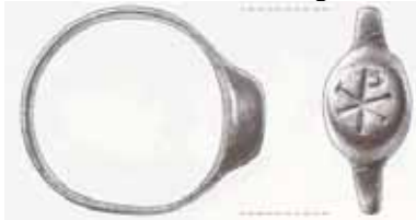
Hornyák László rajza

A Duna menti limes katonai temetőiből ismert, keresztényekhez köthető emlékek száma nagyon csekély. Az igazi érdekességet a 128-as sz. sír jelentette. Ez a boltíves, nagyméretű sírkamra ugyanis belül vakolva és festve volt. Az ismert pécsi ókeresztény sírkamráktól eltekintve erre igen kevés példa akadt eddig a kisebb építmények esetében. A sírkamra kifestése elsősorban geometriai mintákkal történt. Biztosan megállapíthatjuk a rácsminta, az íves vonalvezetés és a nagyobb felületeket kitöltő kifestés megvalósulását. Egyelőre kérdéses, hogy volt-e négyzetes hálódísz, vagy pontszerű, telekör díszítéses festés is. A többféle ecsetkezelési technika és a színárnyalatok valamivel bonyolultabb mintakincs meglétét sem zárják ki egyértelműen. Csak feltételezhetjük, hogy az ide temetkezők közül valakinek egyházi funkciója is lehetett, hiszen a festett sírkamra olyan ritkaság, ami önmagában is bizonyíték az elhunytak emlékének fokozottabb megőrzési szándékára, illetve megbecsülésére.