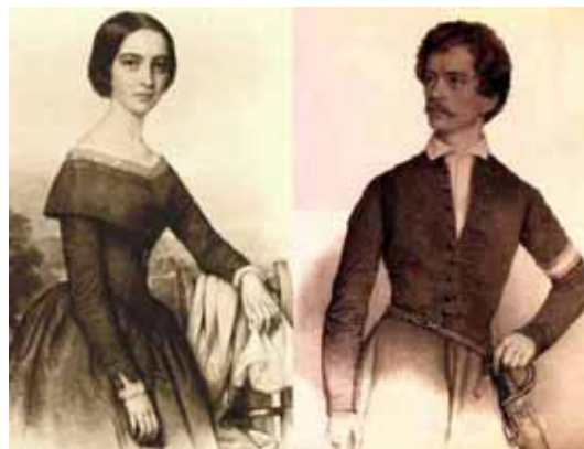
Szendrey Júlia és Petőfi Sándor

Szendrey Júlia kétségtelenül kitűnt nemcsak szépségével, hanem műveltségével – zenét tanult, táncolt, idegen nyelveket tanult –, egyéni öltözködésével (pl. nadrágot hordott), merész viselkedésével. Keszthelyen született 1828. december 29-én és Pesten halt meg 1868. szeptember 6-án. Petőfivel 1846. szeptember 8-án találkozott először, s rá egy évre ugyanezen a napon összeházasodtak. 1848. március 15-én ő varrta és tűzte föl Petőfi mellé a később ismertté vált kokárda első példányát. Petőfi halála – eltűnése – után sokat kutatott utána. Sokan elítélték azért, mert viszonylag korán, 1850. július 21-én férjhez ment Horvát Árpád tudóshoz, akitől négy gyermeke született. Fiatalon, negyven éves korában halt meg. Halálos ágyán apjához írt levelében így vallott Petőfi iránt érzett szerelméről: „ Apám azt mondta, hogy én boldogtalan leszek Sándor mellett. Asszonynak még nem adatott olyan boldogság, mint amit én éreztem, mikor együtt voltunk Sándorommal. Királynője voltam, imádtam engem és én imádtam őt. Mi voltunk a legboldogabb emberpár a világon, s ha a végzet közbe nem szól, ma is azok volnánk. ”