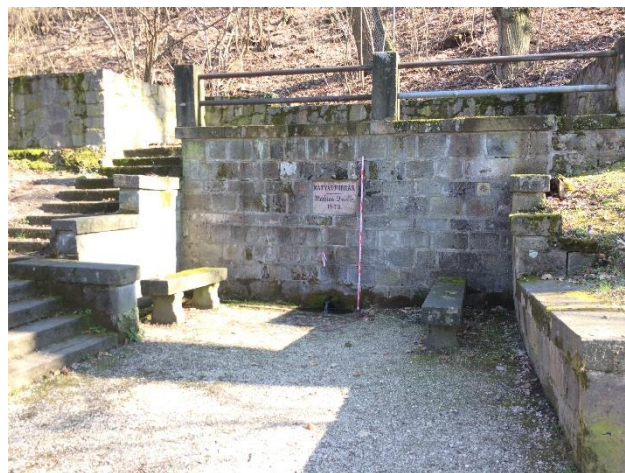
A Várkertben 1873-ban elkészült Mátyás-forrás (Matthias Quelle) foglalatja és pihenőhely.