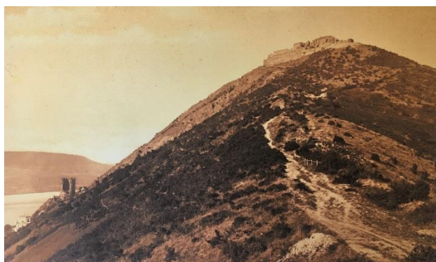
A kálváriától a Fellelgvár felé vezető gyalogút 1871-ben.

Türr egyetértett Viktorin szándékával, mindössze azt javasolta, hogy kérését egy hozzáintézett levélben ismételje meg. Erre azért volt szükség, hogy az adományozók hozzájárulását megkapja.