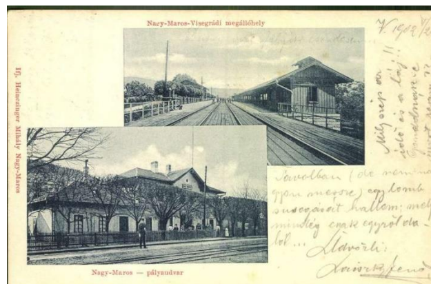
A nagymarosi vasúti megállóhelyek.

Visegrád-átkelés megállóhelyen volt kénytelen leszállni. Várható volt, hogy a király a következő évek őszén is visszatér, ezért a vasúttársaság új állomásépületet építtetett, amely 1890-re készült el. Ezt az állomást 1894-ben miniszteri engedéllyel Nagymaros-Visegrád megállóhelynek nevezték el. Az ide érkező visegrádi utasokat 1890. május 22-től a vonatok menetrendjéhez igazodva egy csavargőzös vitte át a túlparton lévő révállomáshoz.