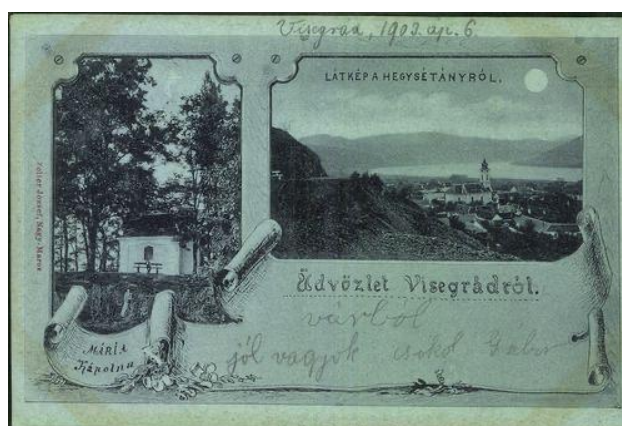
Egy képeslap 1909-ből, amely a hegy sétányról, vagyis a Ferenc József sétányról készült.

Az emlékműtől induló kisebb lépcsősor minden bizonnyal a millennium idején készült. Ezekben a lépcsőkön lehetett feljutni arra a bizonyos „esplanad”-ra, amelyet Hochschild Albert építtetett. A kizárólag a szép kilátás miatt készült Ferenc József sétány 800-900 m hosszan húzódott a Várhegy nyugati oldalán. Ez a lépcsősor a kálvária kényelmesebb megközelítésére is szolgált, és egyúttal egyszerűbben a Fellegvárba vezető gyalogút is elérhető volt.