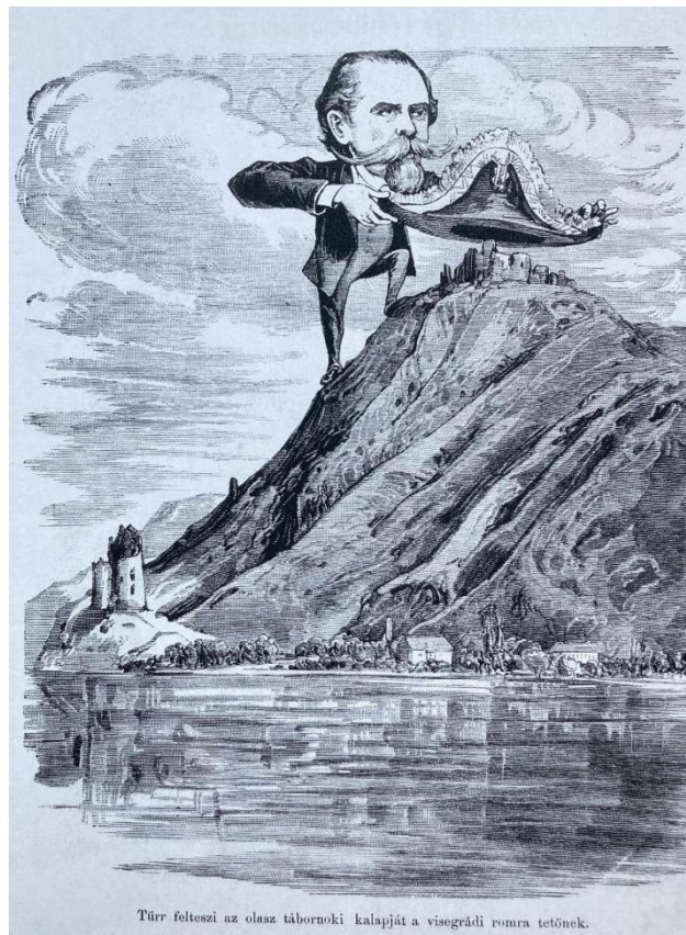
Türr felteszi olasz tábornoki kalapját a visegrádi romra tetőnek. – Az Üstökös 1870-04-30. 18. lapszám