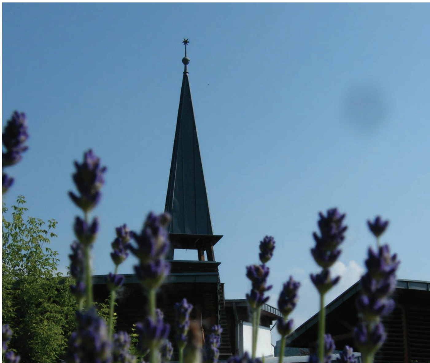
Visegrád református temploma

Nyomdai munkák: Pethő Nyomdaipari Szolgáltató Kft., Budapest