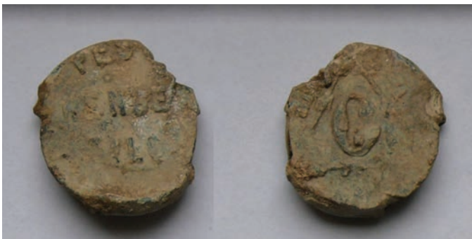
A Pesti Hengermalom plombája

A 2022-es ásatás folyamán a Sibrik-dombon talált újkori plombák három gőzmalom termékét jelzik. A „Pesti Henger Malom” az országban elsőként, 1841-ben beinduló gőzmalom, a József Hengermalom utódja volt és a mai Margit híd pesti hídfőjénél állt. Innen 0-s liszt került Visegrádra.