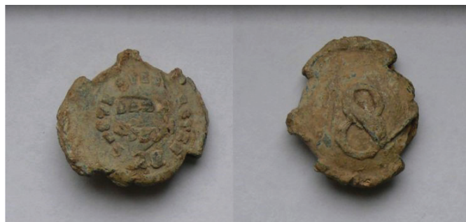
Az Erste Ofen-Pester Dampfmühlen plombája

Valamelyik egységéből 8-as lisztet szállítottak Visegrádra.