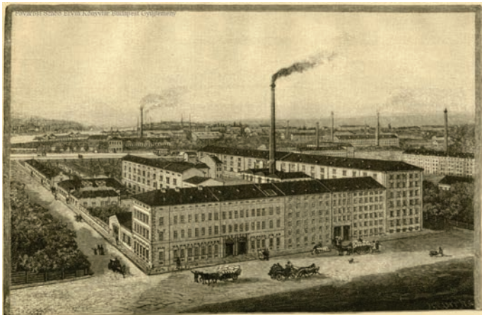
A Pesti Hengermalom és környéke az 1880-as évek végén.

Az első nagy ipartelep az 1860-1870-es években alakult ki a korabeli Pesttől északra (ma: Újlipótváros), ahol gőzmalmok, sörfőzők, cukorfinomító és gőzfűrésztel mellett különböző raktárak is helyet kaptak.