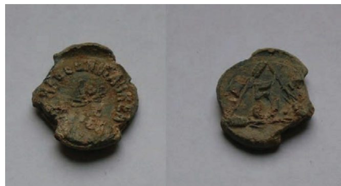
Plombák a Haggenmacher malmokból

Korhatározásnál támpontot jelent, hogy a német nyelvű darabok inkább a 19. század második feléhez köthetők. Ugyanakkor nemcsak a felirat, hanem a lisztosztályozás megjelenítése is árulkodó lehet. Az 1891 utáni szabvány előírása szerint a szám körül három búzakalászból kialakított háromszöget kell elhelyezni két betűvel (M = Mehl, azaz liszt és T = Typ, vagyis típus). Ezek alapján a visegrádi plombák közül három köthető az 1870–1880-as évekhez: a Heinrich Haggenmacher Dampf