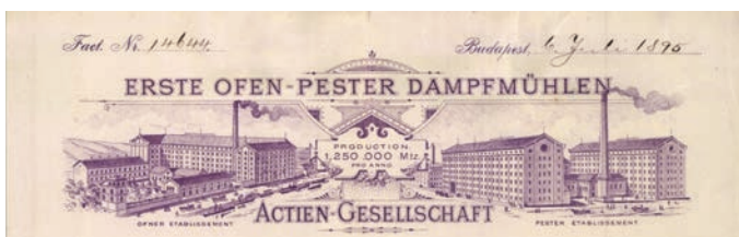
Az Erste Ofen-Pester Dampfmühlen számlájának fejléce a társaság malmainak képével.

Az „Erste Ofen Pester Dampf Mühlen AG” vagyis az Első Buda-Pesti Gőzmalmok Részvénytársaság, két malommal rendelkezett, egyik a pesti oldalon, a mai Stollár Béla utcában, másik a budai oldalon, a mai Lajos utca környékén állt.