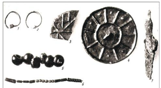
A pilismaróti temető 19. sírjának leletei, köztük a poliédeses végű fülbevalók és a nomád tükör.