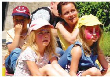
Ovimajális a Fellegvár Óvodában