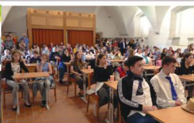
A 8. osztályosok filmje a ballagásra