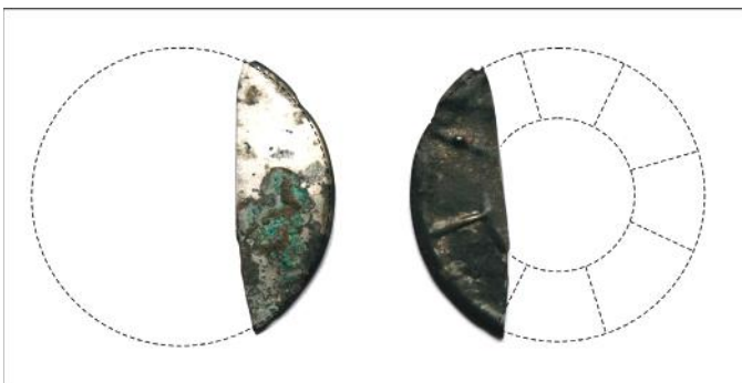
A Sibrik-dombi nomád tükör elő- és hátlapja.