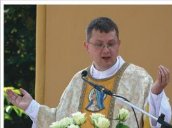
Ünnepi mise a Millenniumi káponánál