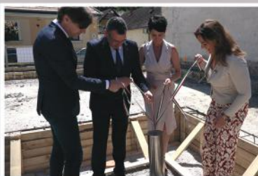
A Fellegvár Óvoda új épületének ünnepélyes alapkövetétele