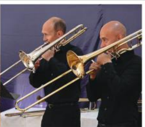
A Sonatores Pannoniae rézfúvós együttes hangversenye