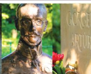
Emlékezés Gőrgői Artúr honvédtábornokra