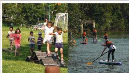
Kihívás napi programok