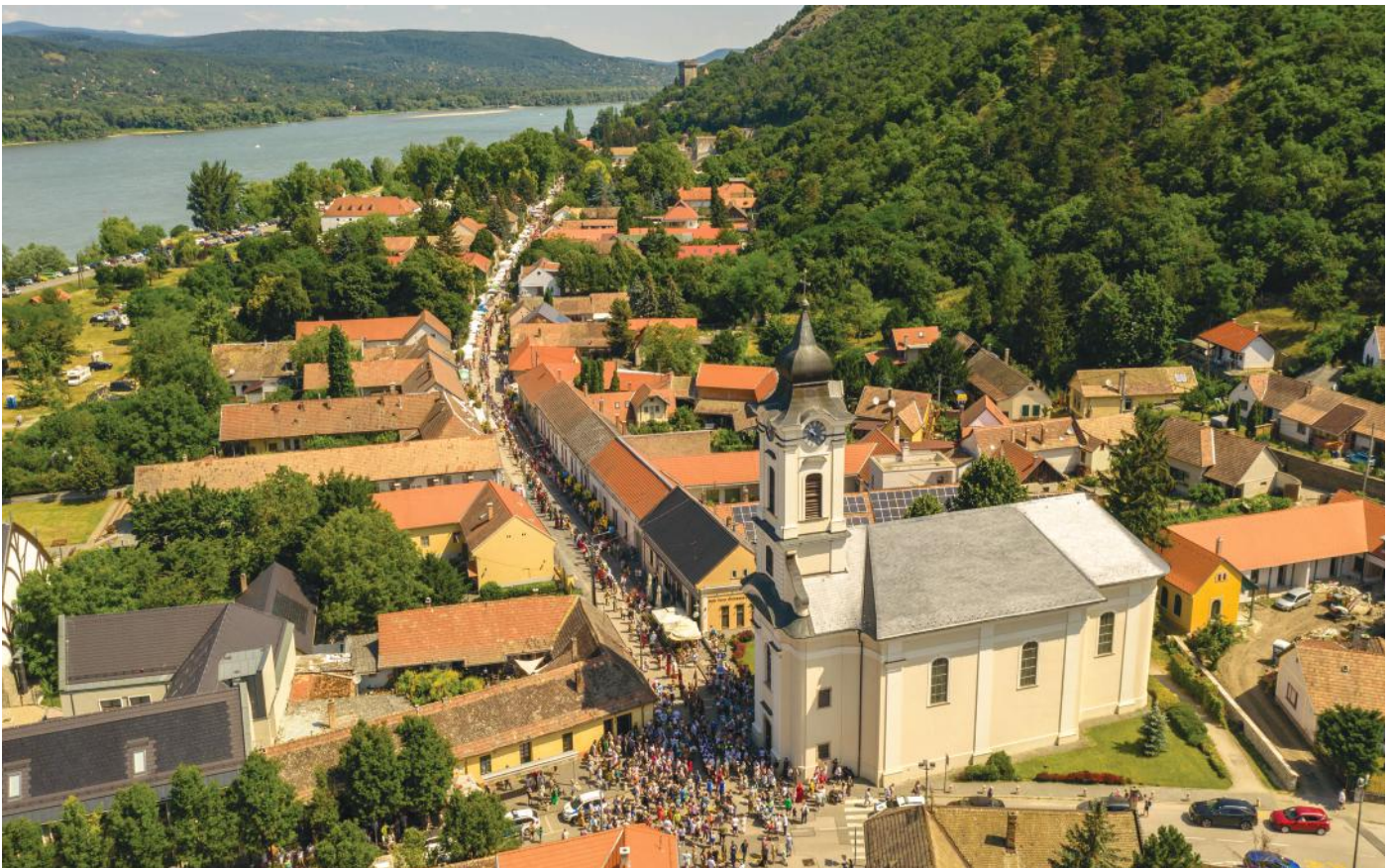
Királyi menet a Fő utcában