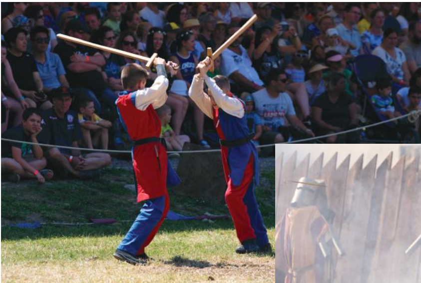
Apródok a küzdőtéren