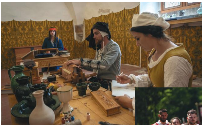
Középkori életkép a Királyi palotában