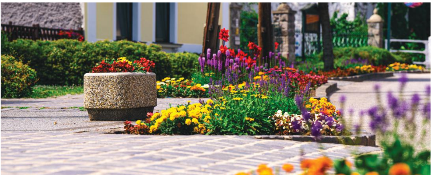
Virágos Fő utca