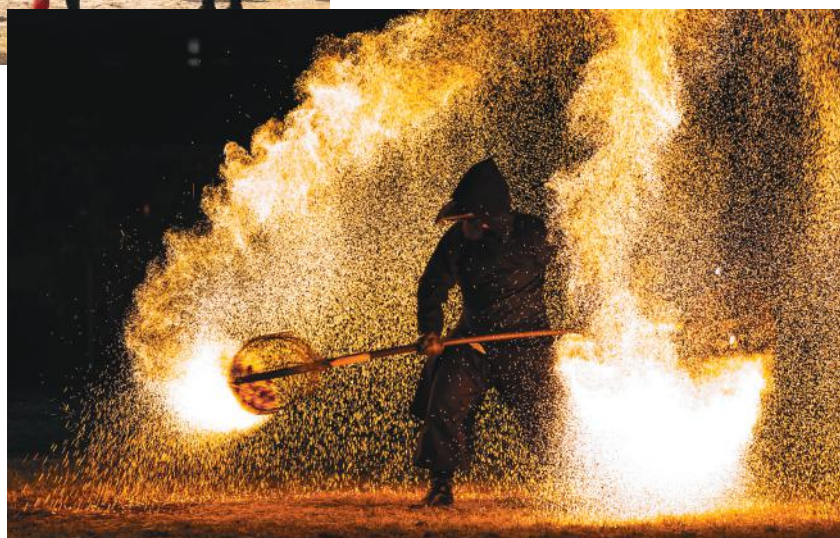
Tűz az éjszakában