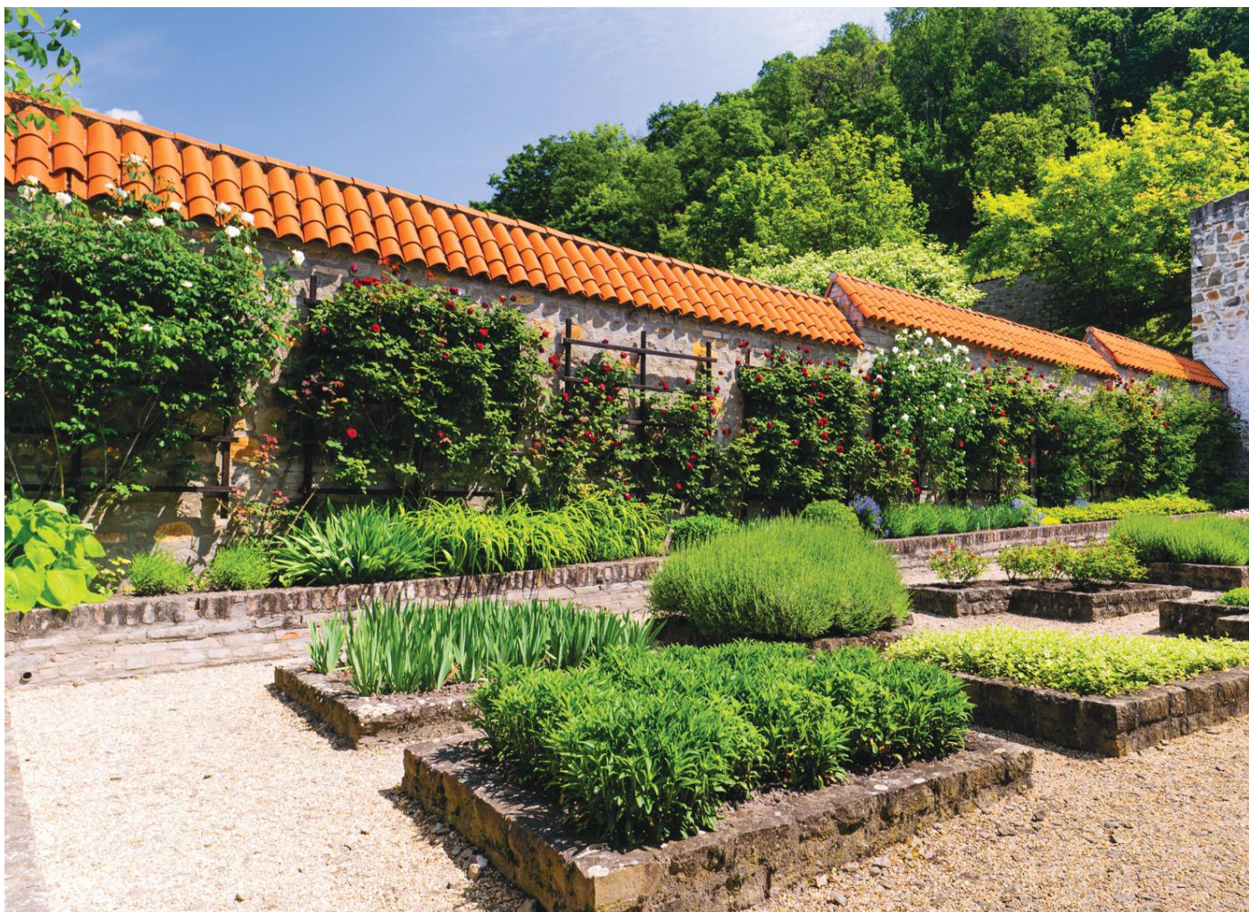
A Királyi palota kertje

a nyári reggel, az újult ígéret, itt lakik benned, bennünk, nem török, végtelen kék gömb, megkapod, ha kéred, a távolát – hisz közel van. Örök.