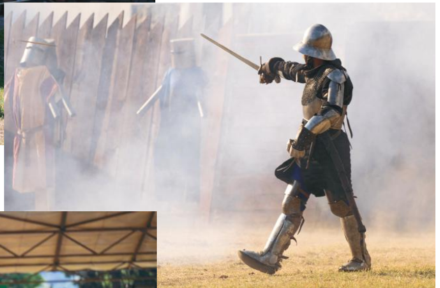
Irány a csata