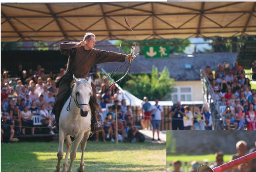
Kassai Lajos lovasíjász világbajnok