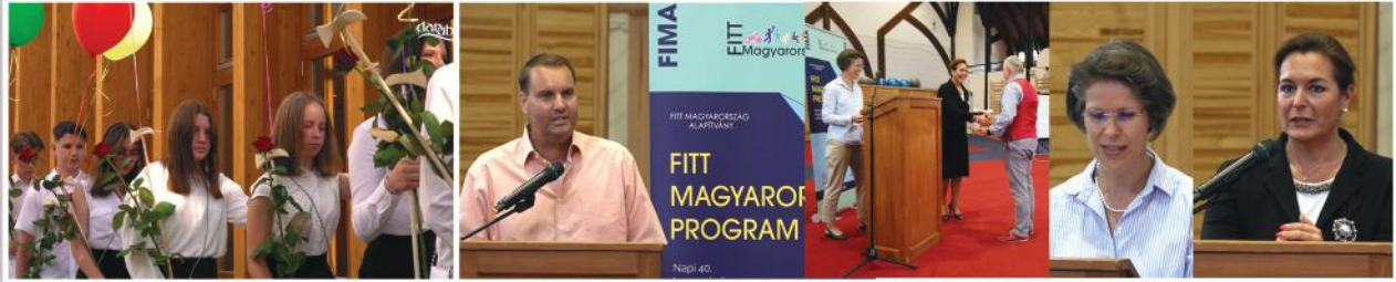
Ballagás az Áprily Lajos Általános Iskolában