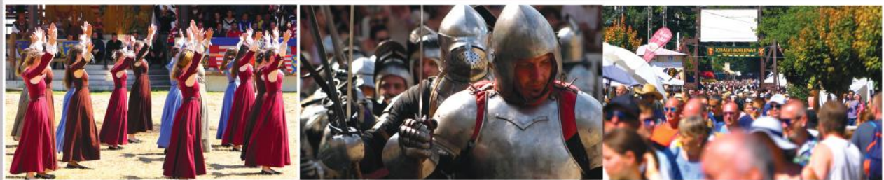
38. Visegrádi Nemzetközi Palotajátékok