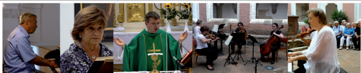
Katolikus szentmisék közvetítése