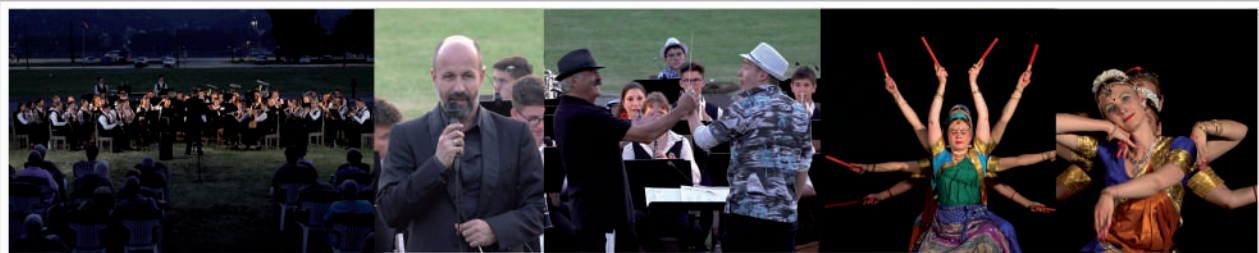
A Nemzeti Ifjúsági Fúvószenekar koncertje - A Trigatu indiai táncsoport előadása