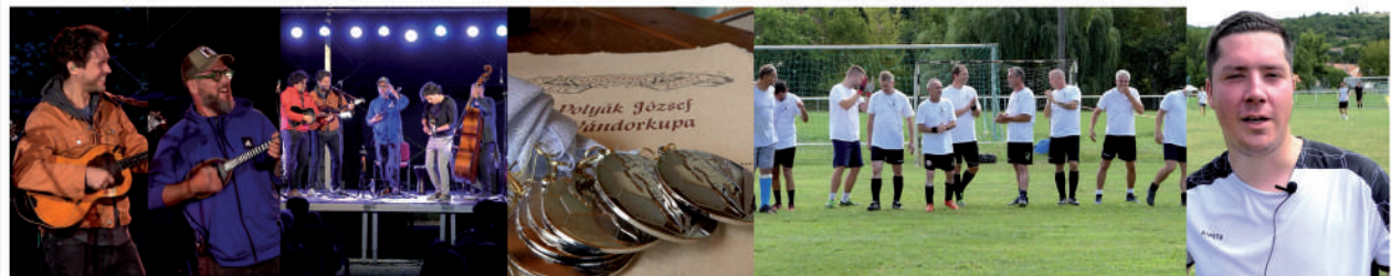
A Söndörgő együttes koncertje