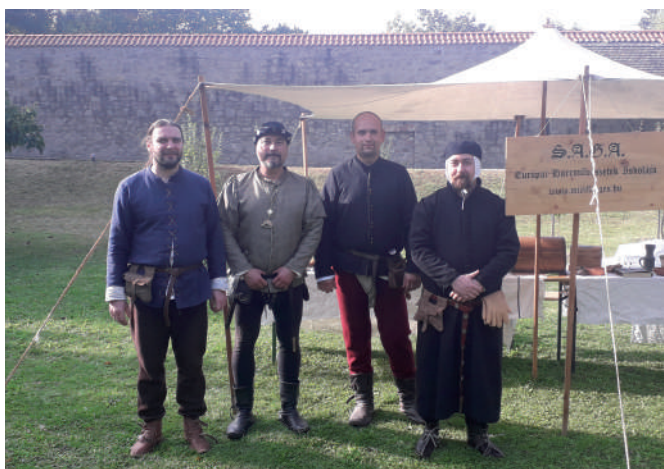
A SAGA Egyesület a királyi palotában (2022. október)

A város, történelmi múltjának és különösen az évi rendszerességgel megrendezett Palotajátékoknak köszönhetően immáron évtizedek óta mágnesként vonzza az ország és a közeli külföld különféle hagyományőrző-múltidéző csoportjait. A 2010-es évek eleje óta tartozik közéjük a budapest illetőségű Schola Artis Gladii et Armorum (A Kard és Fegyverek Művészetének Iskolája, röviden S.A.G.A.) nevű egyesület, amely a kiemelt jelentőségű rendezvényen túl évente több más alkalommal is élvezheti Visegrád és a Mátyás Király Múzeum (MKM) vendégszeretétét.