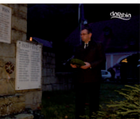
Emlékezés Zsitvay Tiborra és a világháborús visegrádi hősökre