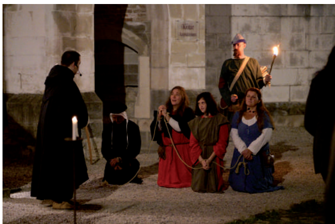
Élőszereplős történelmi játék a királyi palotában (2021. szeptember)

Terveink és elképzeléseink szerint a közeljövőben önálló programokkal is bemutatkozhatunk Visegrád közönsége előtt a város történelmi helyszínein a Mátyás Király Múzeum és a Mátyás Király Művelődési Ház segítségével és támogatásával. Reméljük, ezen ismeretterjesztő és szórakoztató rendezvények során mind több érdeklődő és látogató ismerheti meg az „élő középkor” színes és izgalmas világát.