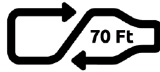
Újratölthető, többutas palack jelölése

A leszerződött és a fogyasztók számára elérhető visszaváltó pontokat a MOHU weboldalán és a hamarosan elérhető REpont applikációban tesszük közzé.