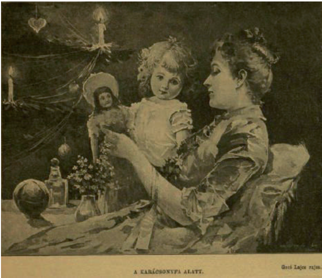
Polgári karácsonyi idill a századfordulón (Vasárnapi Újság 1883.)

„Nincs olyan víg vásár egy is a világon, mint a karácsoni vásár. Ennek a vígsága egészen másnemű, zajtalanabb, szelídebb, családiasabb, majdnem azt mondom: szentebb. Itt muzsikaszó nincs, pecsenyés-sátor, meg lacikonyha sincs, sarkantyú-pengés meg héjje-hujja sincs, részeg ember sem találkozik, - mégis minden arc mosolyog, minden szem ragyog, minden ajk cseveg vidám jó kedvében... Azért a legvígabb vásár a világon a karácsoni, mert itt nem testi dolgokat, szükségleteket, házi holmit, vagy effélét, hanem tiszta örömet vásárol magának minden ember, a legszegényebb is. Az utcaseprő gyermeke ökölnyi karácsonfájának s a rajta függő egy pár diónak, aranyfüstös papírburkában és rongyból készített kis babácskájának éppen úgy örvend, mint a gróf úrficska és kisasszonyka mesterséges és drága játékaik s csecsebecsei nagy halmazának" (Vasárnapi Újság, 1883. száma,