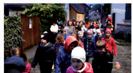
Szentmisék és az önkormányzati ülés közvetítése, összeállítás a Márton-napi rendezvényről