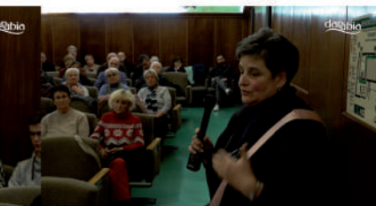
Összefoglaló a közmeghallgatásról és a teljes felvétel közvetítése

Adásunk fogható a Magyar Telekom IPTV-rendszerén a 260-as, a digitális kábelhálózaton a 230-as csatornán (220 MHz) Minden nap 16 órától visegrádi eseményt közvetítünk! Műsorismertetés minden óra 55 perckor látható a képernyőn. Elérhetőségeink: danubiatv@gmail.com, 06-70-940-5034. Műsoraink visszanezhetők weboldalunkon is: danubiatv.hu