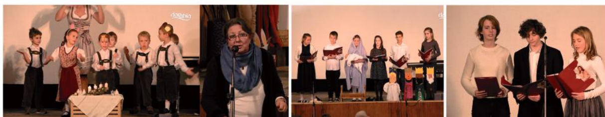
Gyerekek műsorai a Német Nemzetiségi Önkormányzat közmeghallgatásán

Adásunk fogható a Magyar Telekom IPTV-rendszerén a 260-as, a digitális kábelhálózaton a 230-as csatornán (220 MHz) Minden nap 16 órától visegrádi eseményt közvetítünk! Műsorismertetés minden óra 55 perckor látható a képernyőn. Elérhetőségeink: danubiatv@gmail.com, 06-70-940-5034. Műsoraink visszanezhetők weboldalunkon is: danubiatv.hu