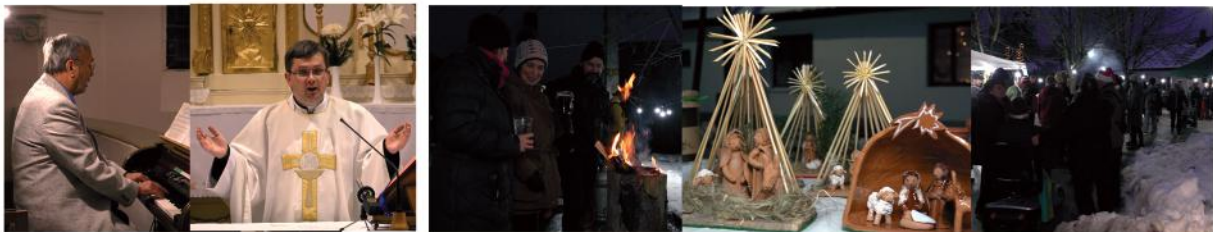
Szentmisék közvetítése - Adventi vendégvásár a Német Nemzetiségi Önkormányzat szervezésében