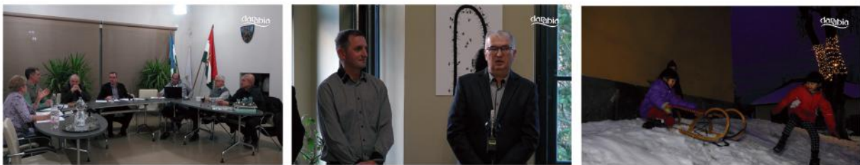
Önkormányzati ülés - Kaszás Norbert fotóművész, természetfotós Feketén-fehéren című kiállítása Gyerekek szánkóznak az adventi vendégvásár idején a Millennium Kápolnánál