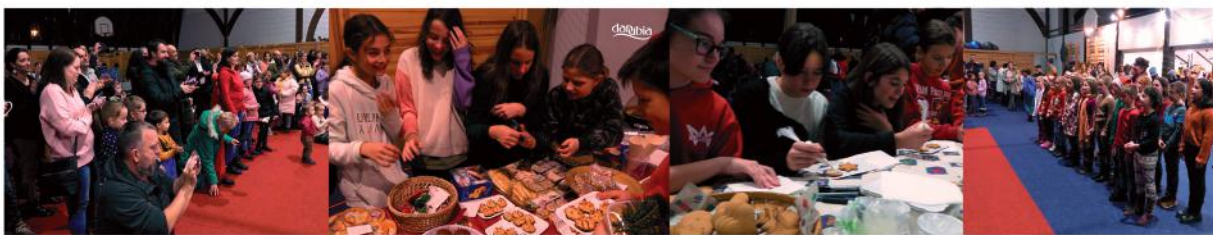
Karácsonyi vásár és családi nap az Áprily-iskolában