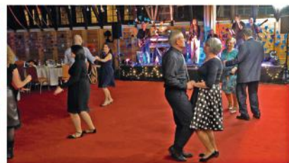
Farsangi bál az Áprily-iskoláért