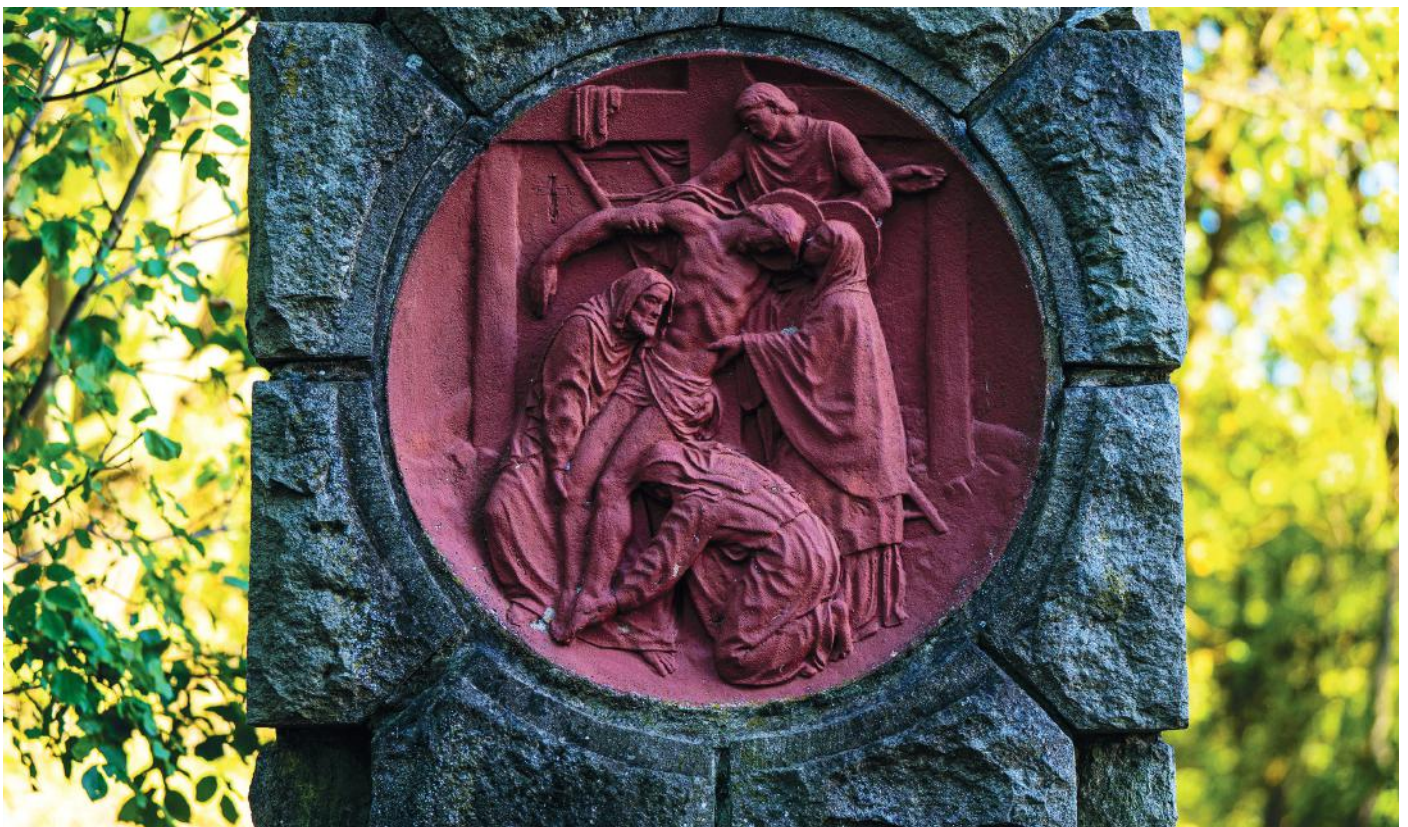
Jézust leveszik a keresztről – stáció Visegrádon