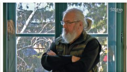
Kiállítás Békefi András grafikusművész alkotásaiból és Moór Györgyi fotóiból