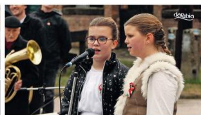
Megemlékezés az 1848-49-es forradalom és szabadságharc 177. évfordulóján

Adásunk fogható a Magyar Telekom IPTV-rendszerén a 260-as csatornán. Minden nap 16 órától visegrádi eseményt közvetítünk! Műsorismertetés minden óra 55 perckor látható a képernyőn. Elérhetőségeink: danubiatv@gmail.com, 06-70-940-5034. Műsoraink visszanezhetők weboldalunkon is: danubiatv.hu