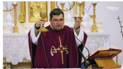
Jótekonysági farsangi koncert a zeneiskoláért, Önkormányzati ülések és szentmisék közvetítése