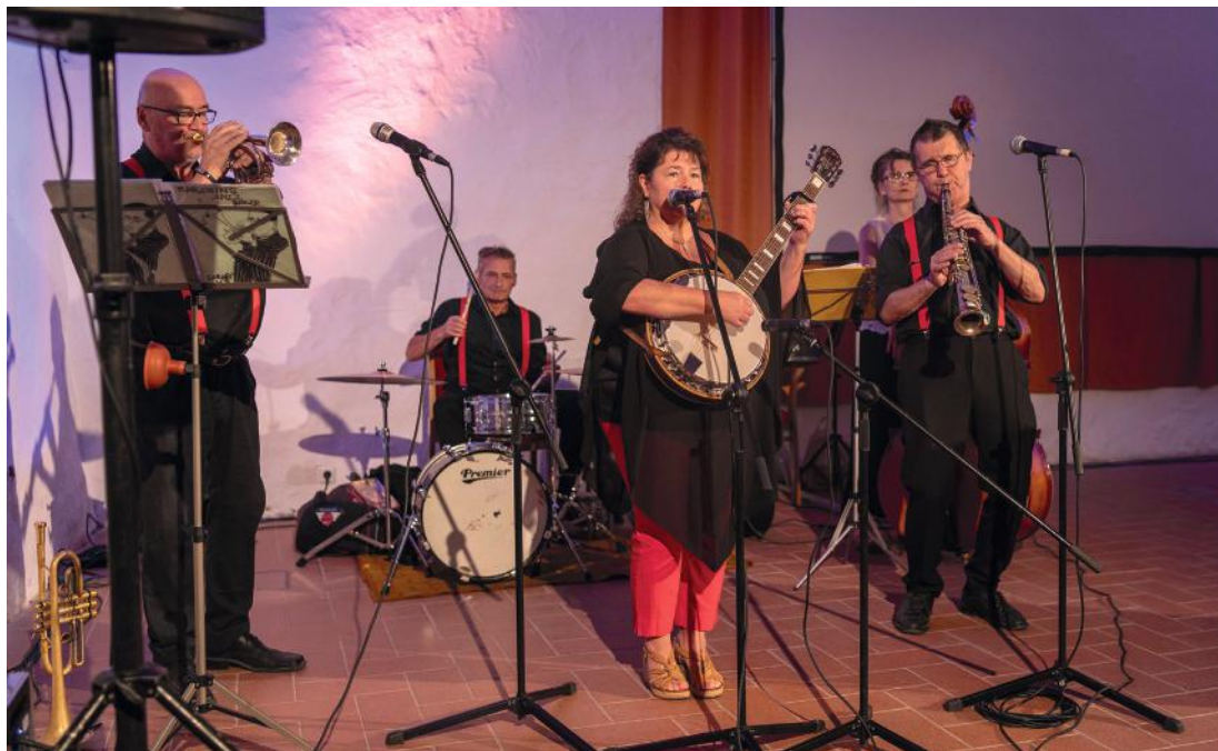
Az ünnepségen közreműködött a Papa Jazz Seven zenekar.