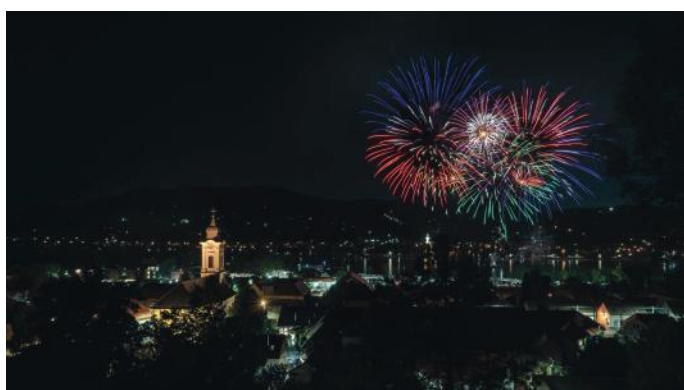
Tűzijáték a Duna felett Visegrád és Nagymaros közös rendezésében