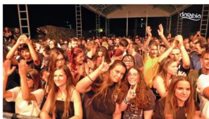
12. Visegrock Fesztivál