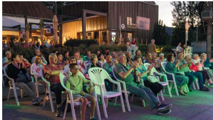
A gálakoncert közönsége