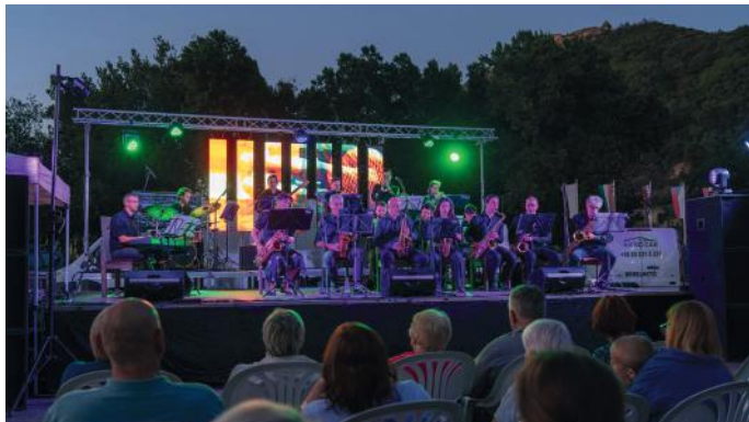
A Kramer Big Band ünnepi gálakoncertje