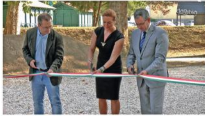
A nagyparkoló megújult környezetének átadó ünnepsége