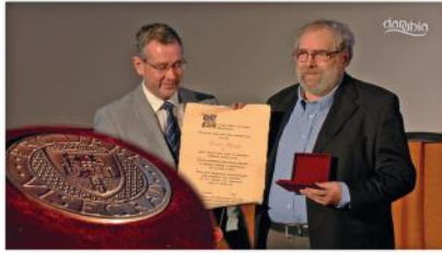
Városi kitüntetések átadása