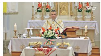
Ünnepi szentmise közvetítése

Adásunk fogható a Magyar Telekom IPTV-rendszerén a 260-as csatornán. Minden nap 16 órától visegrádi eseményt közvetítünk! Műsorismertetés minden óra 55 perckor látható a képernyőn. Elérhetőségeink: danubiatv@gmail.com, 06-70-940-5034. Műsoraink visszanezézhetők weboldalunkon is: danubiatv.hu