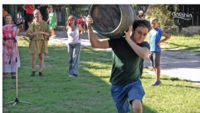
XIX. Quadriburgiumi játékok