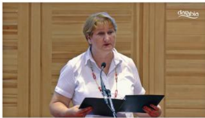
Tanévnyitó ünnepség az Árily Lajos Általános Iskola, Alapfokú Művészeti Iskolában