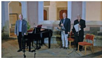
A Marcato együttes koncertje