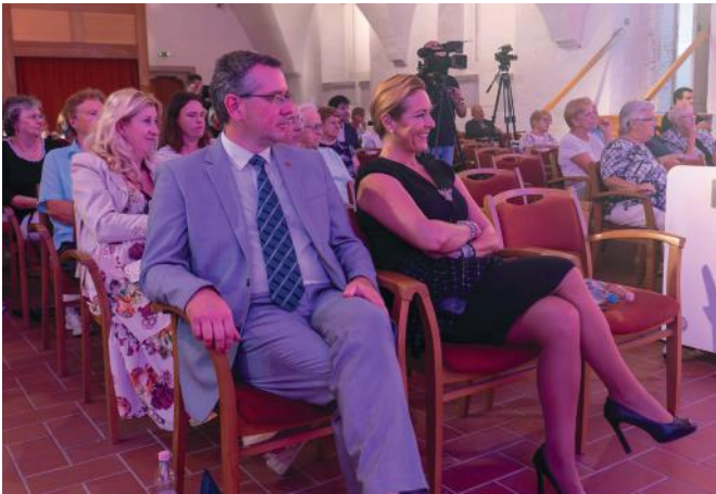
A Városnapi ünnepséget megtisztelte jelenlétével Dr. Vitályos Eszter kormányzati kommunikációért felelős államtitkár, választókerületünk országgyűlési képviselője.