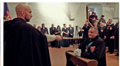
A Szent György Lovagrend 700 éves fennállásának és új tagjai avatásának ünnepe

Adásunk fogható a Magyar Telekom IPTV-rendszerén a 260-as csatornán. Minden nap 16 órától visegrádi eseményt közvetítünk! Műsorismertetés minden óra 55 perckor látható a képernyőn. Elérhetőségeink: danubiatv@gmail.com, 06-70-940-5034. Műsoraink visszanezhetők weboldalunkon is: danubiatv.hu