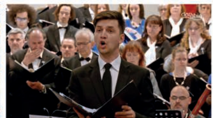
Händel a Duna mentén - G.F. Händel Israel in Egypt című oratóriumának keresztmetszete - Közreműködők: - Ad Libitum Kórus (Baja) - Erkel Ferenc Vegyeskar (Budapest) - Handel Kamarazenekar