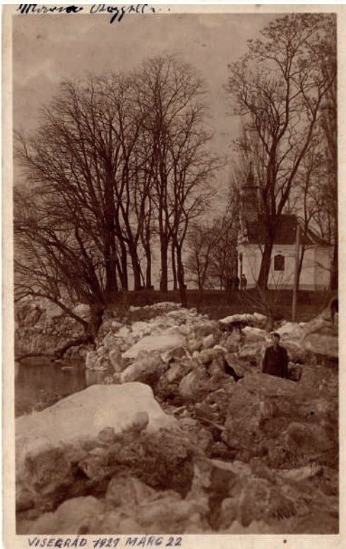
Képeslap 1907-ből és fotó 1929-ből