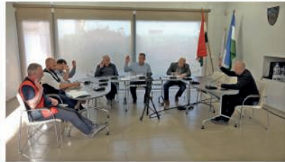
Önkormányzati ülés közvetítése